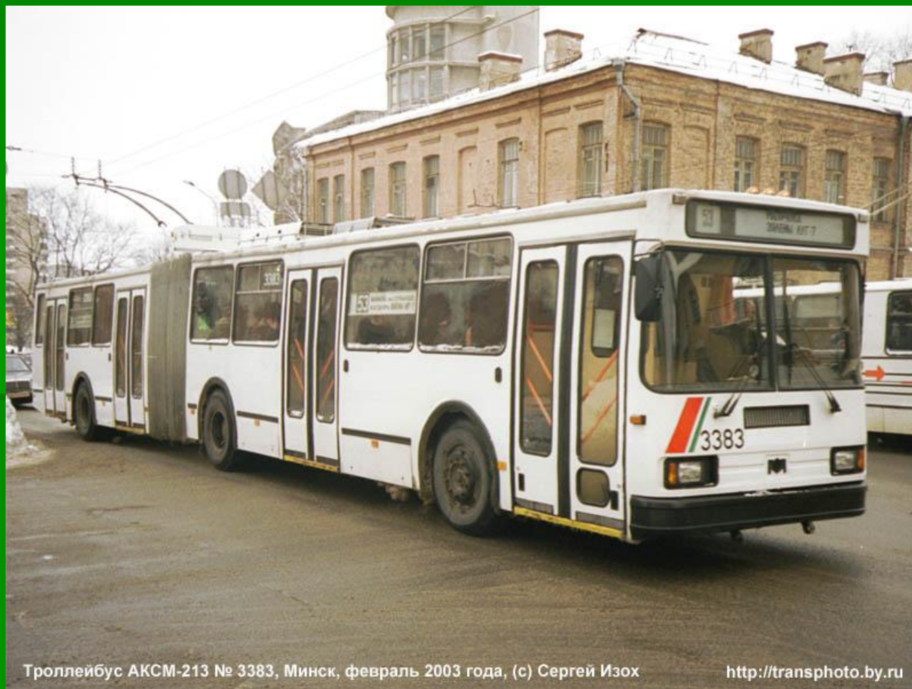
Троллейбус АКМ-213 № 3383, Минск, февраль 2003 года