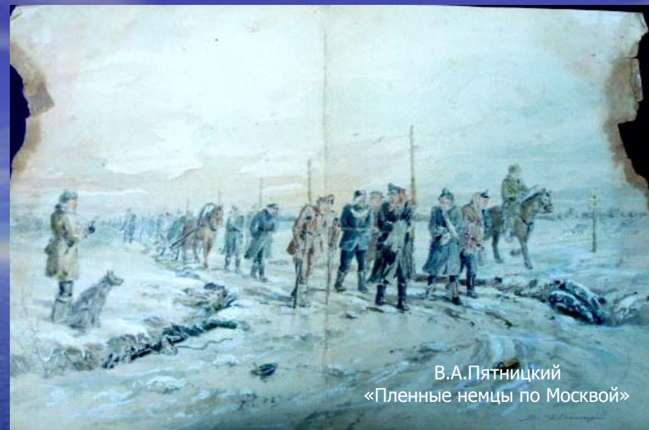
В.А.Пятницкий «Пленные немцы по Москвой»