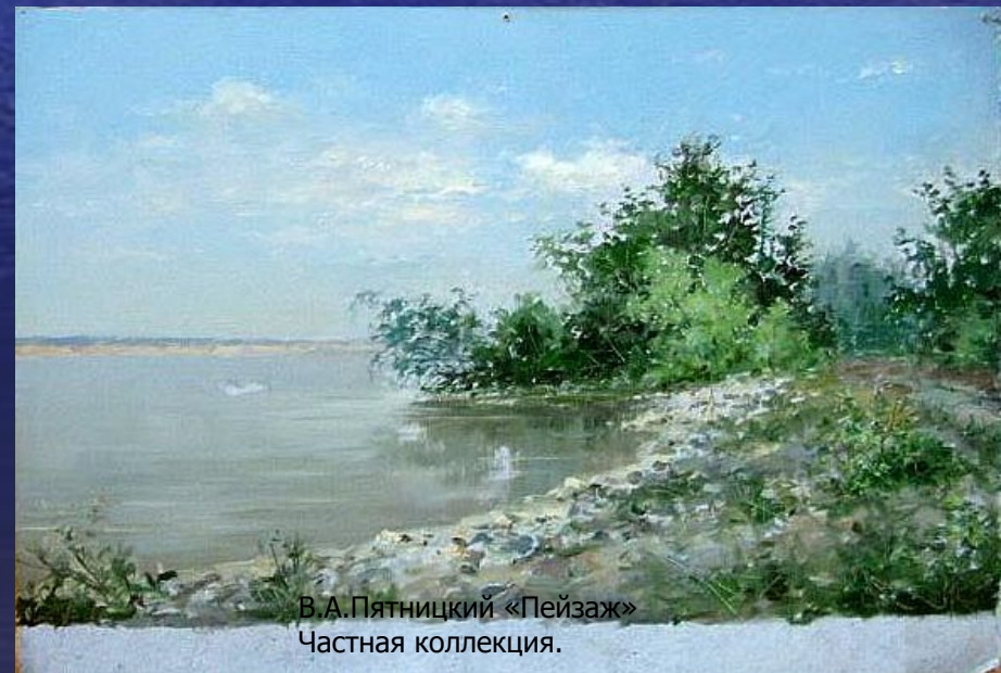
В.А.Пятницкий «Пейзаж» Частная коллекция.