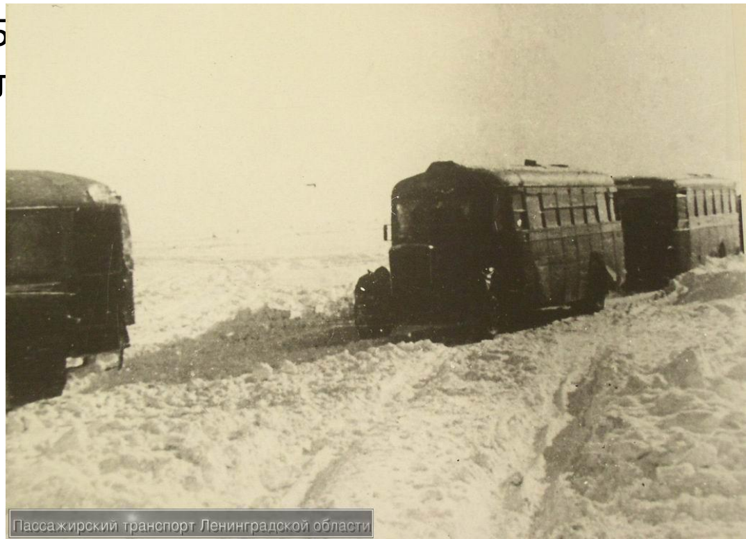
Пассажирский транспорт Ленинградской области

"Дорога жизни" - это не только трасса по льду озера, это путь, который надо было преодолеть от ж/д станции на западном берегу озера до ж/д станции на восточном берегу и обратно. Дорога работала до последней возможности. В середине апреля температура воздуха стала подниматься до 12 - 15 и ледовый покров озера стал быстро разрушаться.