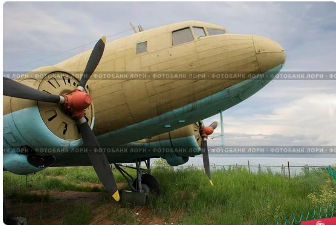
Самолет ЛИ-2. Экспонат музея "Дорога жизни"