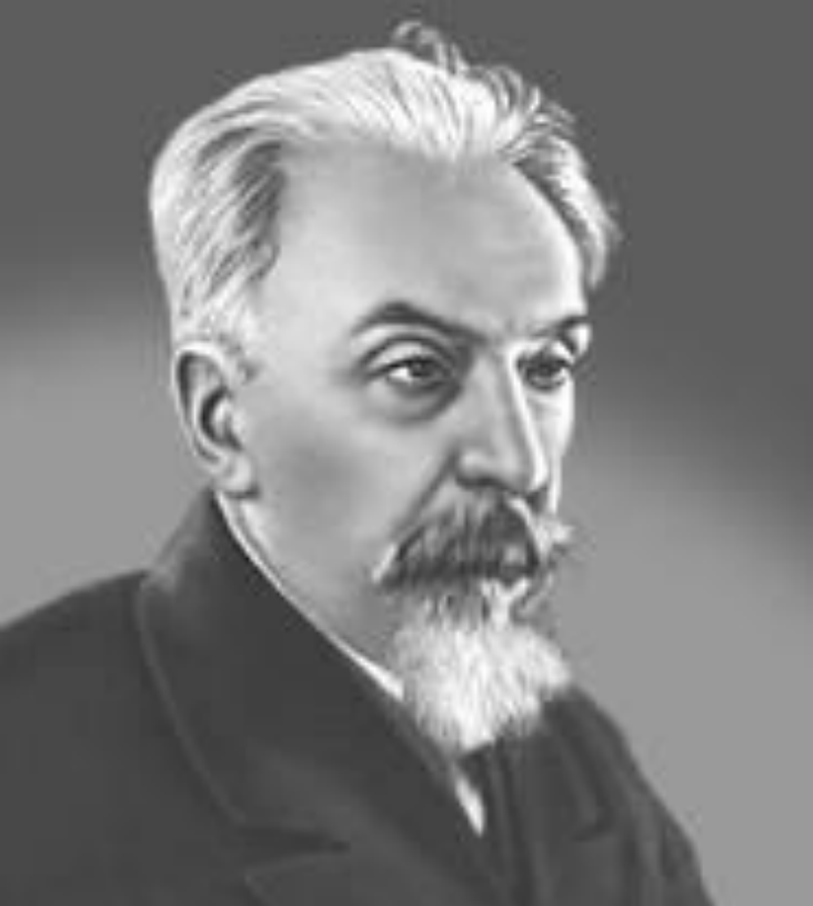
Лев Владимирович Щерба (1880-1944)

Слова категории состояния ученые характеризуют по-разному. Слова категории состояния выделил Л. В. Щерба в 1928 г., включив в эту особую, как он считал, часть речи слова, которые обозначают состояние человека и окружающей среды. К этой части речи он относил слова радостно, можно, нельзя, душно, нужно, темно.