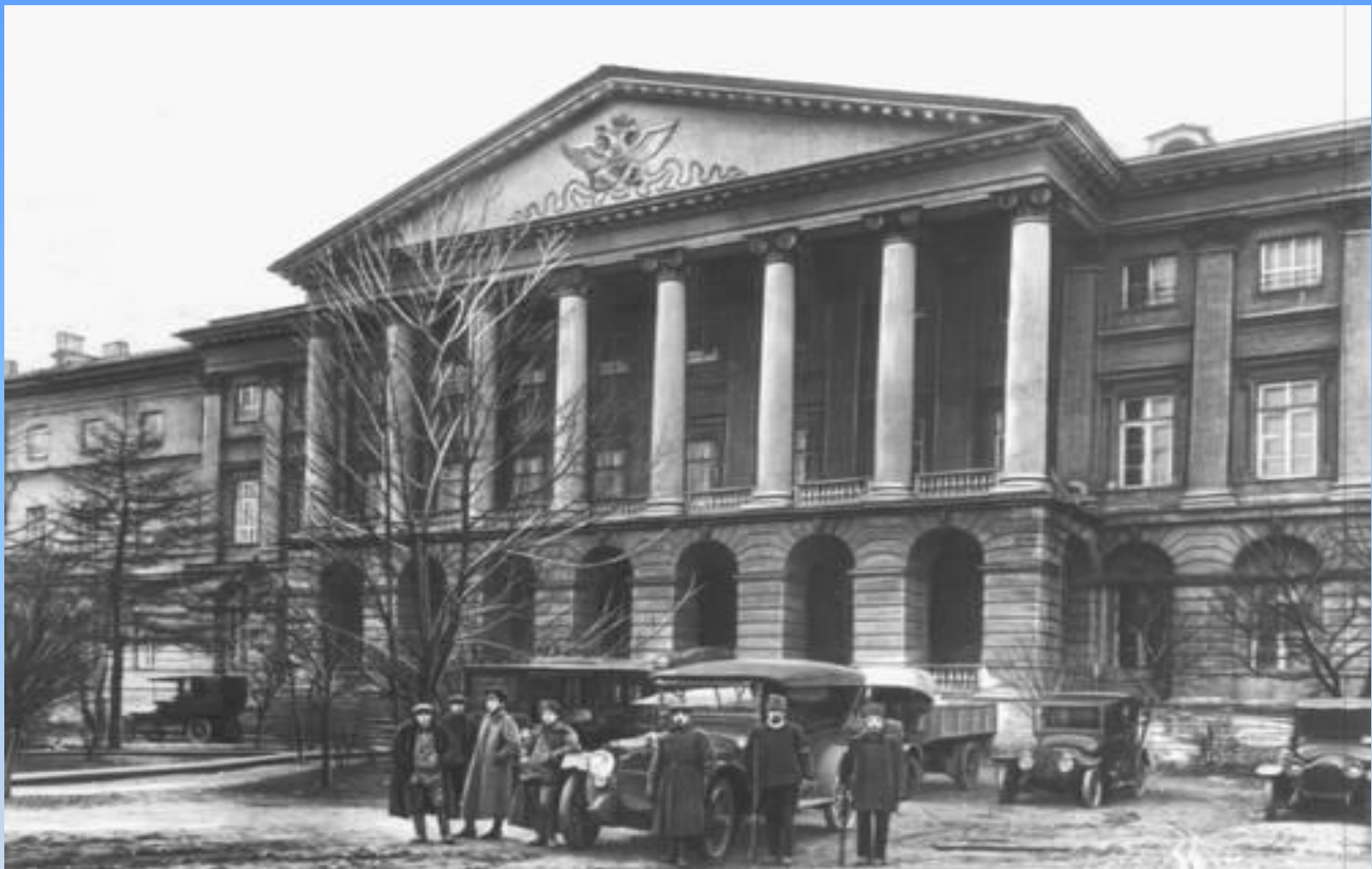
Питер. Смольный (1917).