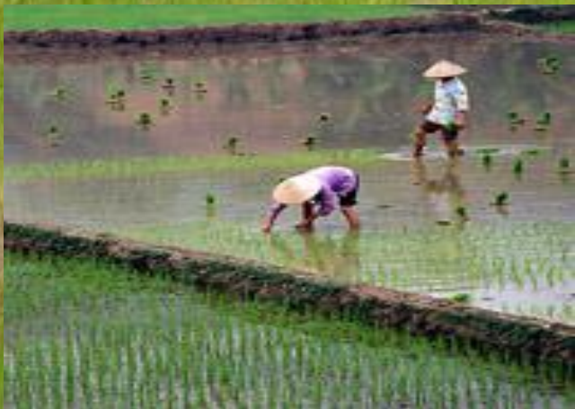
Рис – называют «сыном воды и Солнца». Выращивают его на полях залитых водой.