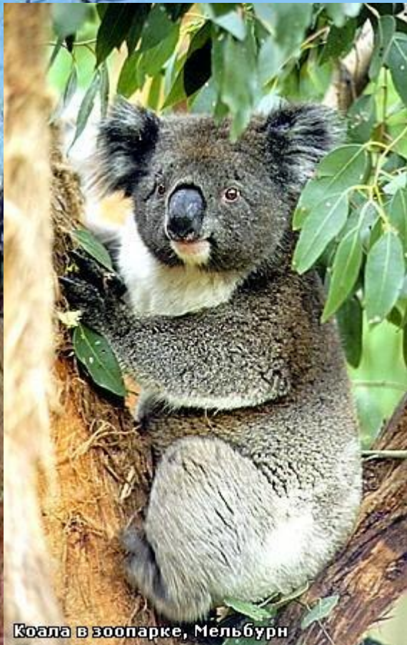
Коала в зоопарке, Мельбурн