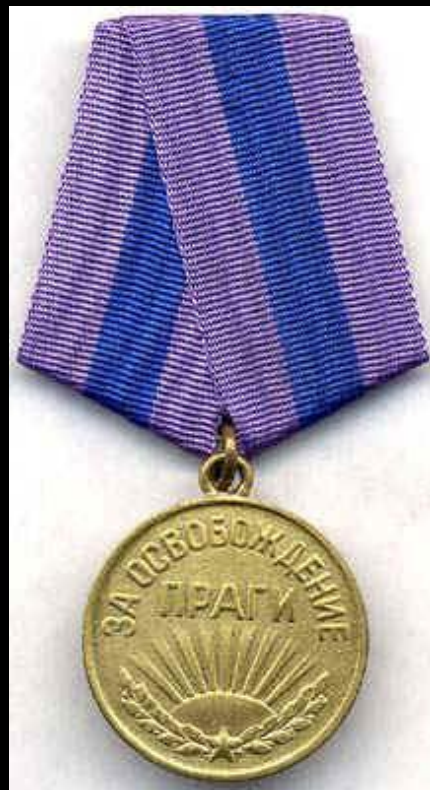
Медаль «За освобождение Праги»