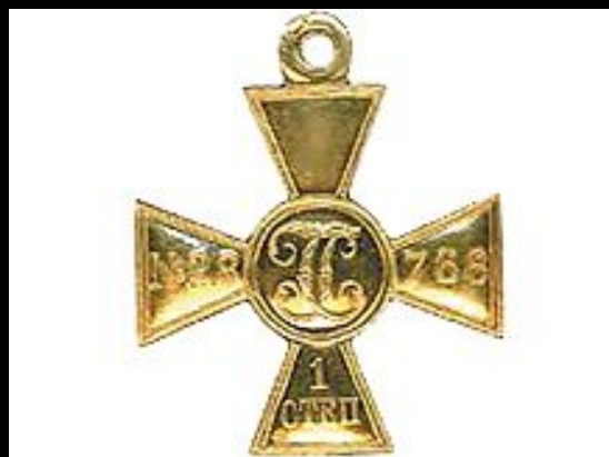
Георгиевский крест 1-й степени