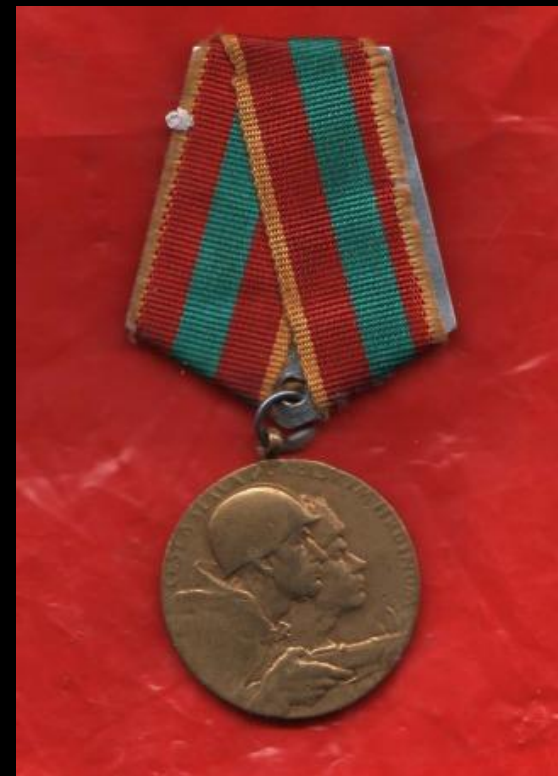
Медаль «За освобождение Будапешта»