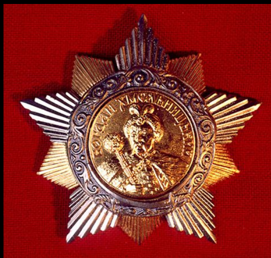
Орден Богдана Хмельниц кого