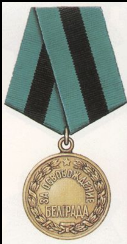
Медаль «За освобождение Белграда»