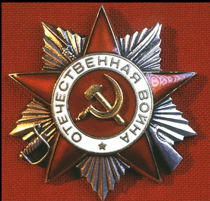
Орден 1-й степени