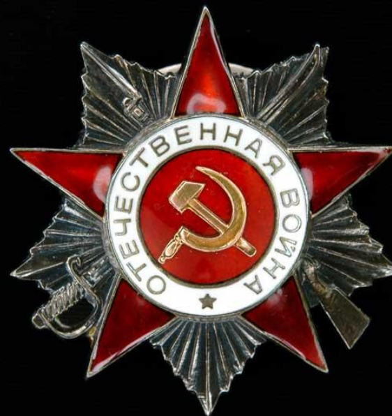
Орден 2-й степени

20 мая 1942 года был учреждён орден Отечественной войны 1-й и 2-й степени. Это была первая награда, появившаяся в годы войны. Этим орденом награждали и военных, и гражданских, которые отличились в борьбе с фашистами.