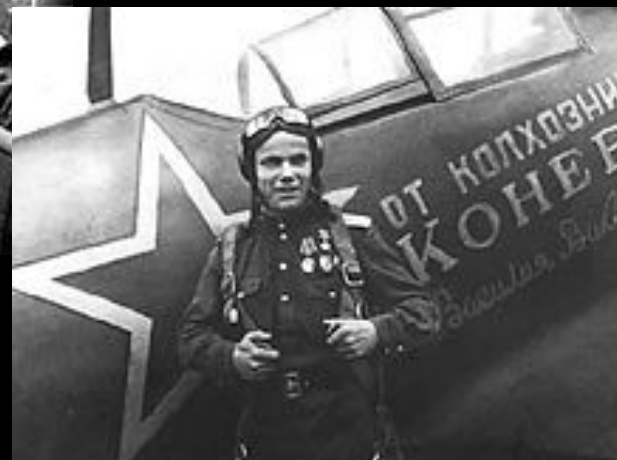
И. Кожедуб в годы войны

Трижды герои Советского Союза – лётчики Александр Покрышкин и Иван Кожедуб.