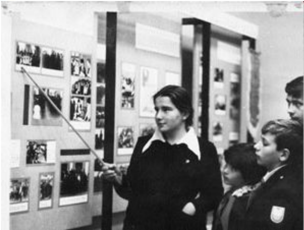
Музей В. Дубинина в школе № 1 г. Керчи