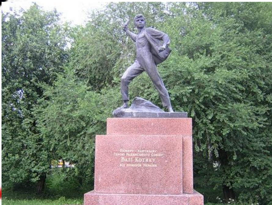
Памятник Вале Котику в Шепетовке