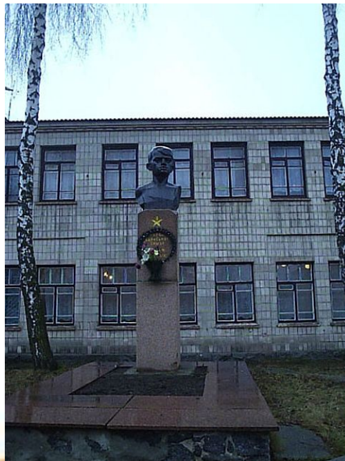
Улица В. Котика в Шепетовке