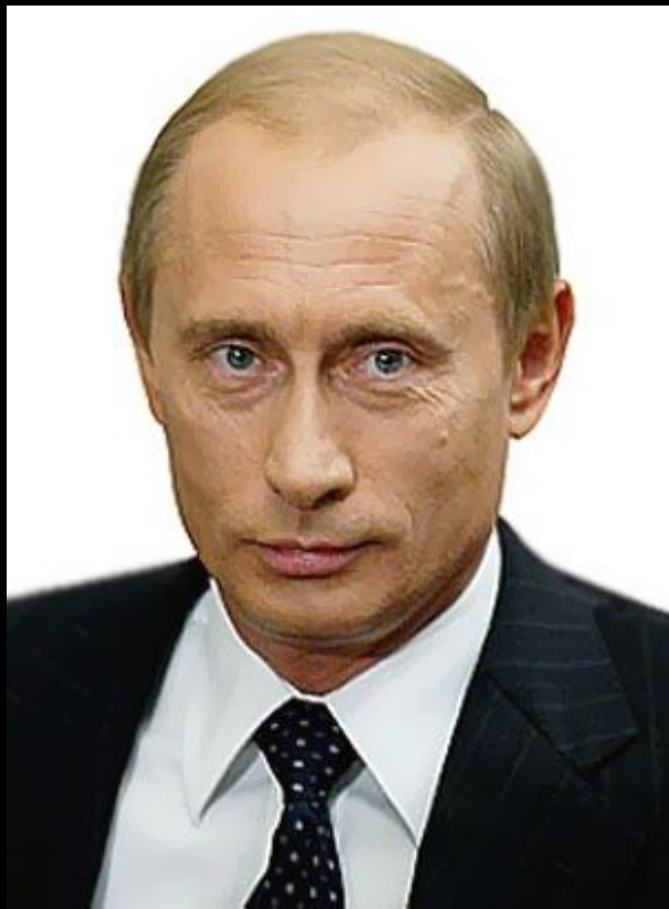
Владимир Владимирович Путин

В 2000 году с приходом В. Путина к власти им было принято решение организовать обширное и долгосрочное мероприятие под названием «приоритетные национальные проекты».