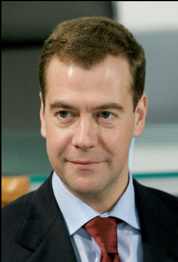
Дмитрий Анатолевич Медведев

«Задачи выполнять – системно и предельно прагматично. Ориентироваться – на достижение осязаемого результата в самой ближайшей перспективе. Параллельно – формировать новую правовую базу и совершенствовать бюджетное