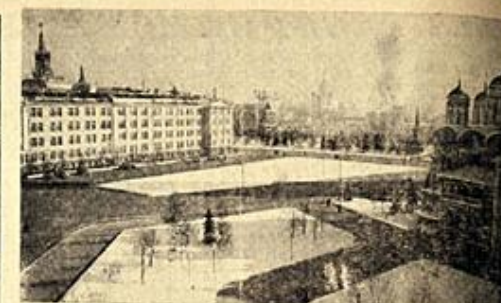
Машинный садик, Павловская площадь, Кремль (вид из Громовского Дворца)