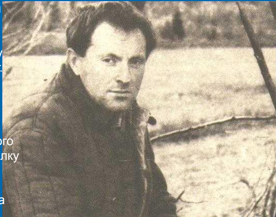
Бродский на полевых работах в ссылке.

Годы спустя в интервью Майклу Скаммелю на вопрос: «Как на Вашу работу повлияли суд и заключение?» Бродский ответил: «Вы знаете, я думаю, это даже пошло мне на пользу, потому что те два года, которые я провел в деревне, – самое лучшее время моей жизни. Я работал тогда больше, чем когда бы то ни было. Днем мне приходилось выполнять физическую работу, но поскольку это был труд в сельском хозяйстве, а не работа на заводе, существовало много периодов отдыха, когда делать нам было нечего».