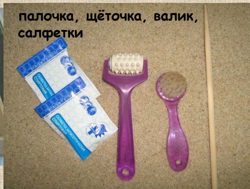
палочка, щёточка, валик, салфетки