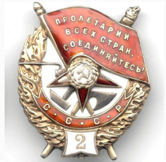
Орден Красного Знамени