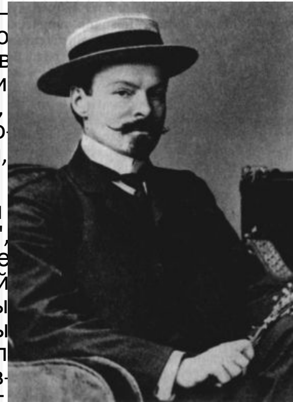
К. Д. Бальмонт