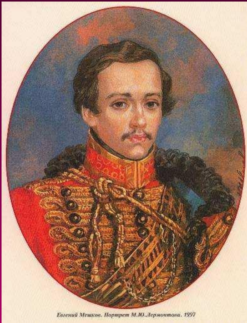
Евгений Мещков. Портрет М.Ю. Лермонтова. 1997

Михаил Юрьевич Лермонтов – русский поэт.