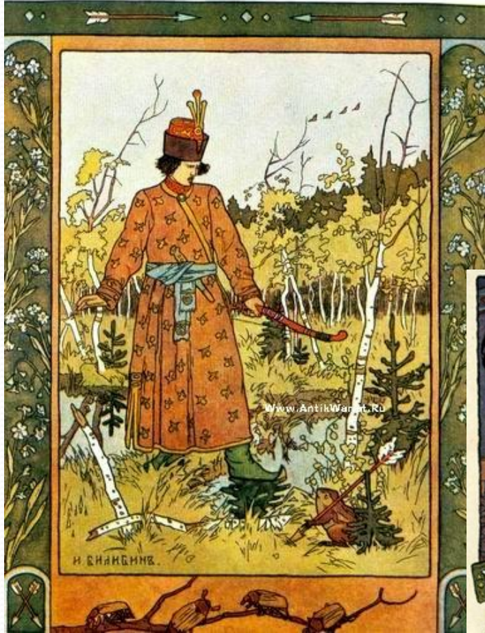
Иллюстрация к сказке «Царевна-лягушка».