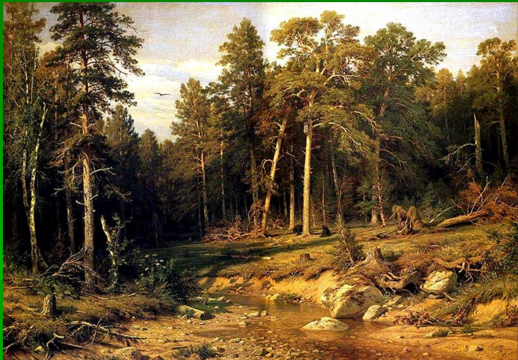
Иван Иванович Шишкин "Сосновый бор"