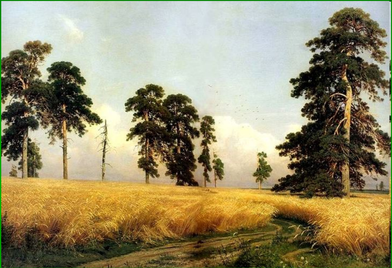
Иван Иванович Шишкин "Рожь"