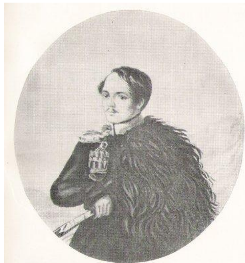
М. Ю. Лермонтов Автопортрет. 1837 г. Акварель.