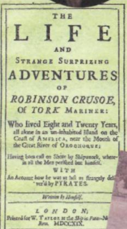
Титульный лист первого издания. Лондон. 1719.

Вы всё еще не догадались кто это? Тогда вам необходимо прочесть книгу Даниэля Дефо «Жизнь и удивительные приключения Робинзона Крузо, моряка из Йорка, прожившего 28 лет в полном одиночестве на необитаемом острове у берегов Америки, близ устья реки Ориноко, куда он был выброшен кораблекрушением, во время которого весь экипаж корабля, кроме него, погиб; с изложением его неожиданного освобождения пиратами, написанные им самим»