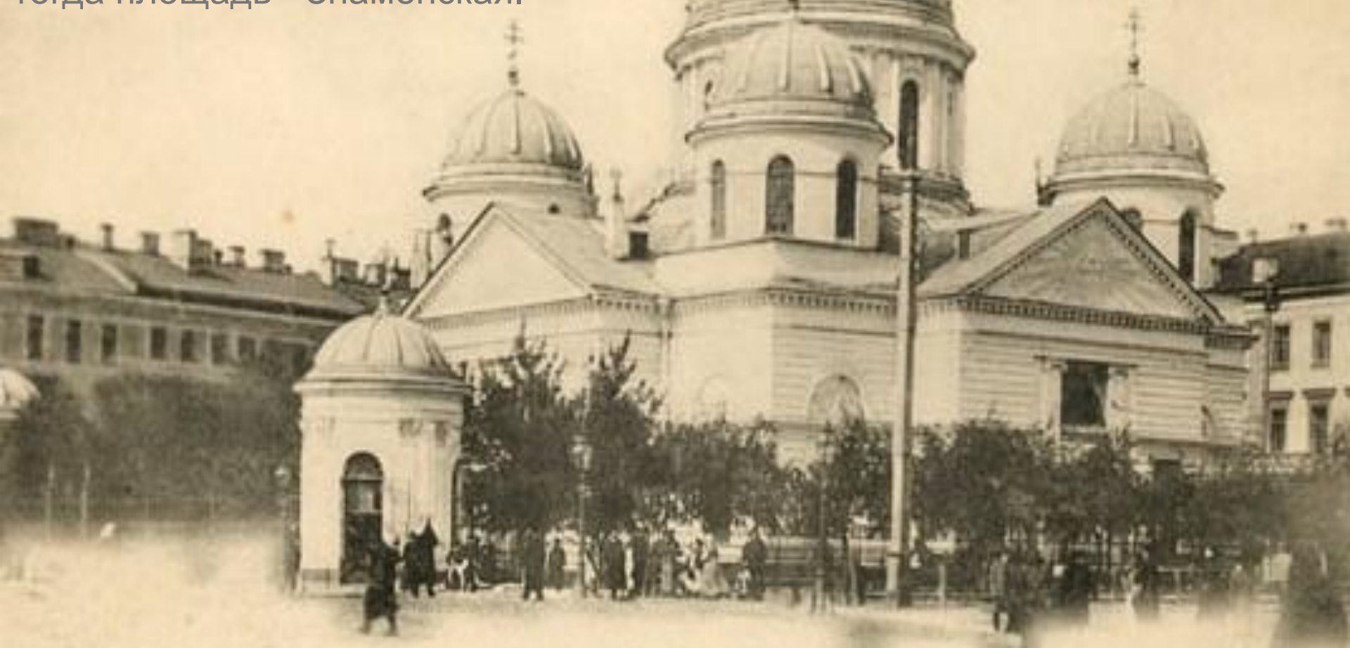
Знаменская церковь — L'Église de l'Apparition de la Vierge

В 1794-1804 годах на углу Невского Проспекта и Лиговского канала по проекту Ф. И. Демерцова была построена церковь во имя Входа Господня в Иерусалим. Церковь в народе была известна как "Знаменская". По её имени и называли тогда площадь - Знаменская.