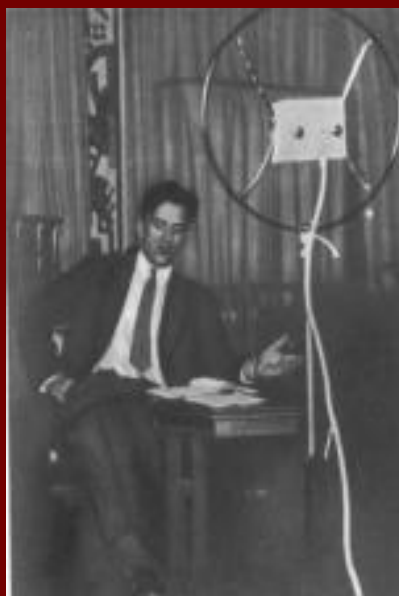
Маяковский на радио.

В 1915—1917 гг. Маяковский проходит военную службу в Петрограде в автошколе. 17 декабря 1918 г. поэт впервые прочел со сцены Матросского театра стихи "Левый марш (Матросам)". В марте 1919 г. он переезжает в Москву, начинает активно сотрудничать в РОСТА (Российское телеграфное агентство), оформляет (как поэт и как художник) для РОСТА агитационно-сатирические плакаты ("Окна РОСТА").