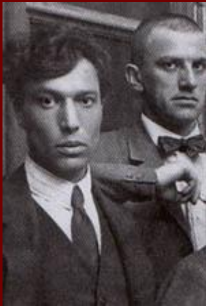
Маяковский и Б Пастернак.

Стихи Маяковского были впервые опубликованы в 1912 году в альманахе группы «Гилея». «Пощечина общественному вкусу», где был помещен и манифест, подписанный им самим В.В Хлебниковым, А.Е Крученых, и Д. Бурлюком, в нарочито эпатирующей форме заявлявший о разрыве с традициями русской классики, необходимости создания нового языка литературы, соответствующего эпохе.