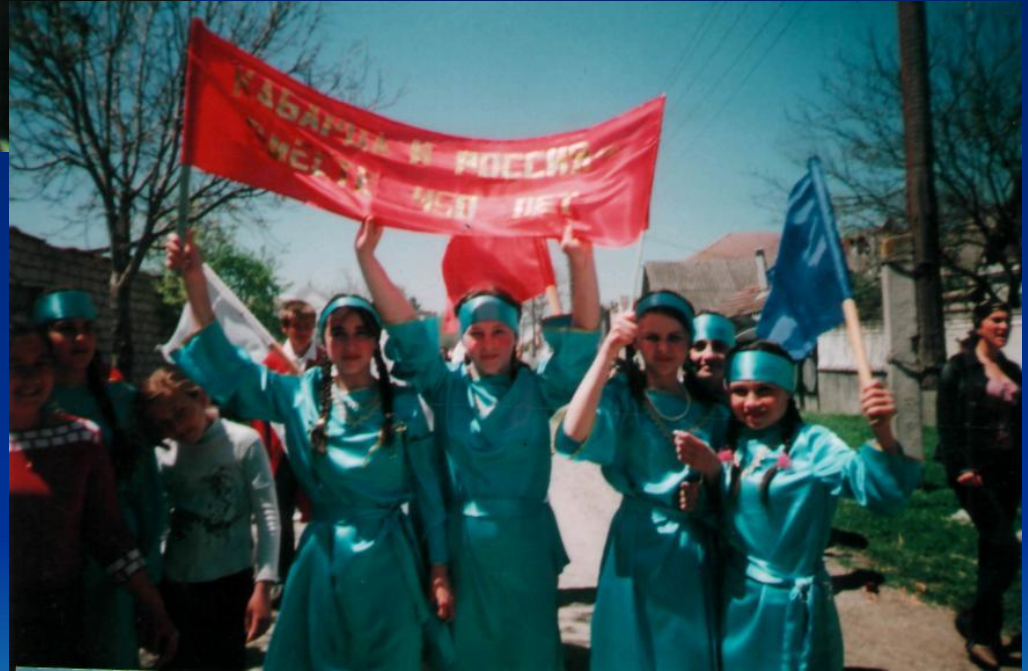
Участники танцевального конкурса