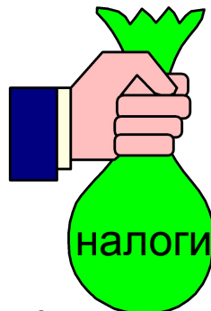
Финансово- кредитное регулирование