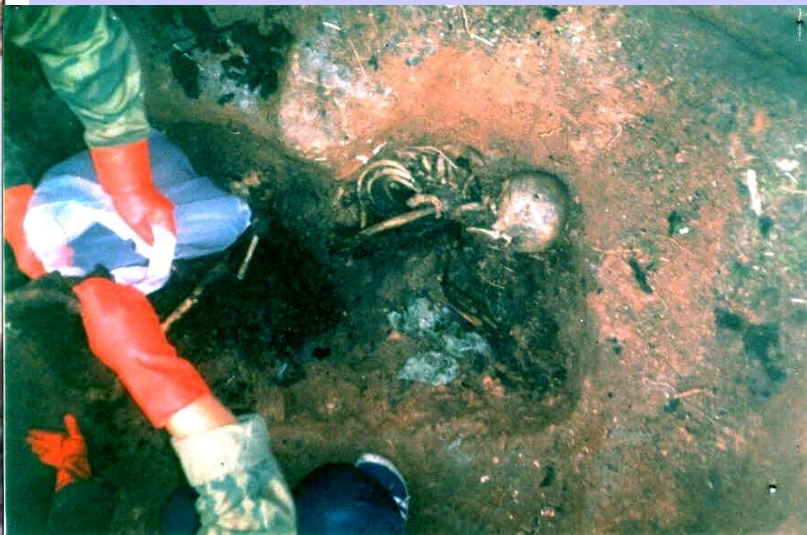
Поисковики проводят эксгумация погибших