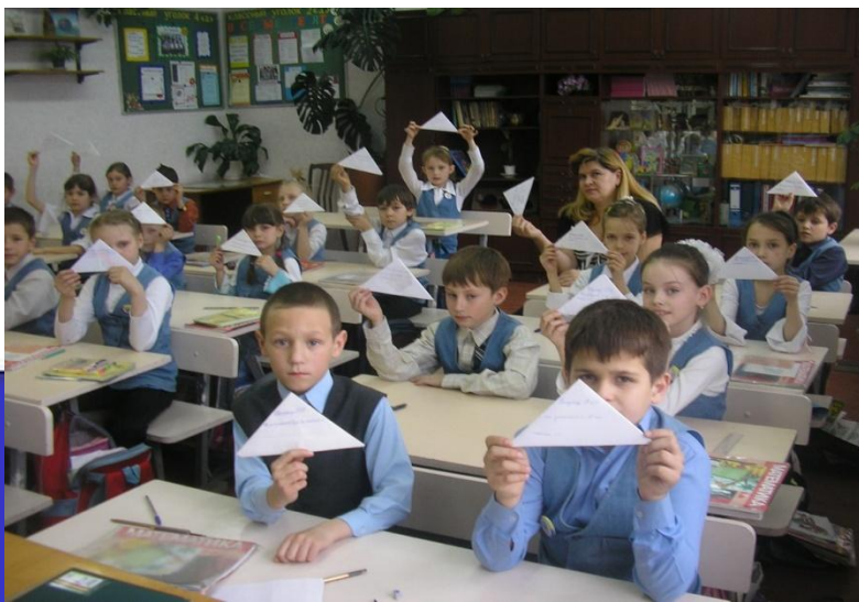
2 «А» изготовил открытки 2007г.