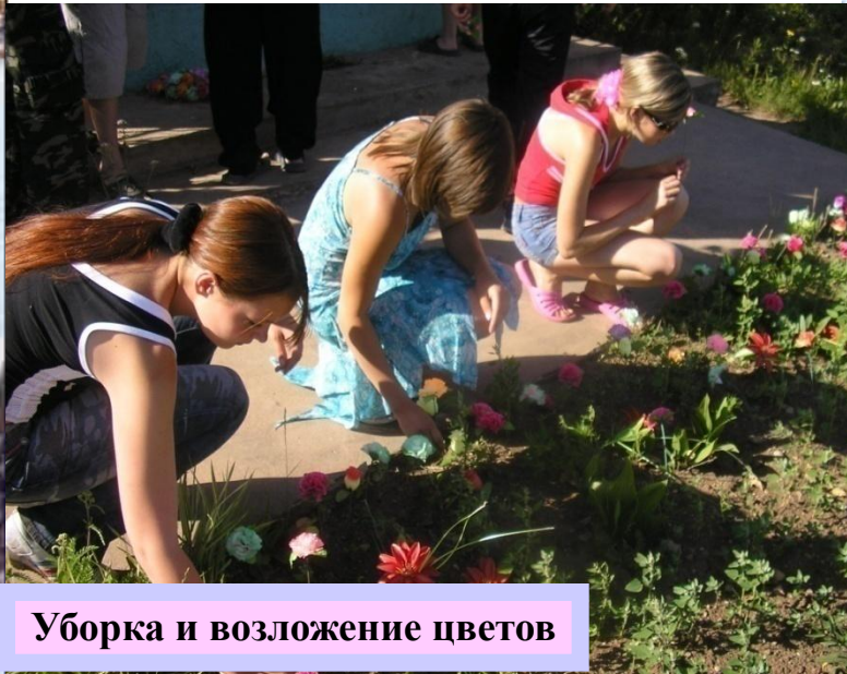
Уборка и возложение цветов