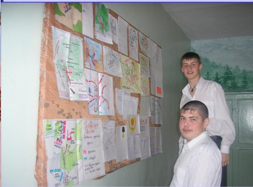
Подготовка к «Вахте памяти»

Традициями жива наша школа. В школе проходят :