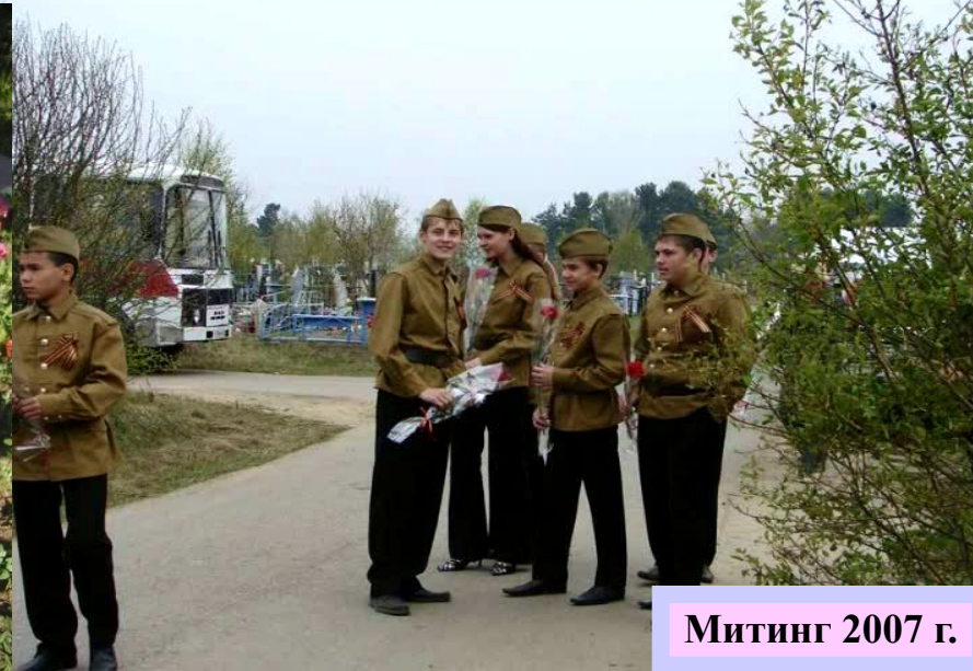
Митинг 2007 г.

Одним из главных направлений в работе отряда занимает Великая отечественная война. Проводиться работа с ветеранами ВОВ; Проведение школьной «Вахты памяти» с участием ветеранов; Уборка возле Обелиска Победы, ветеранских захоронений на шелеховском кладбище; Участие в митингах; Поздравление ветеранов .