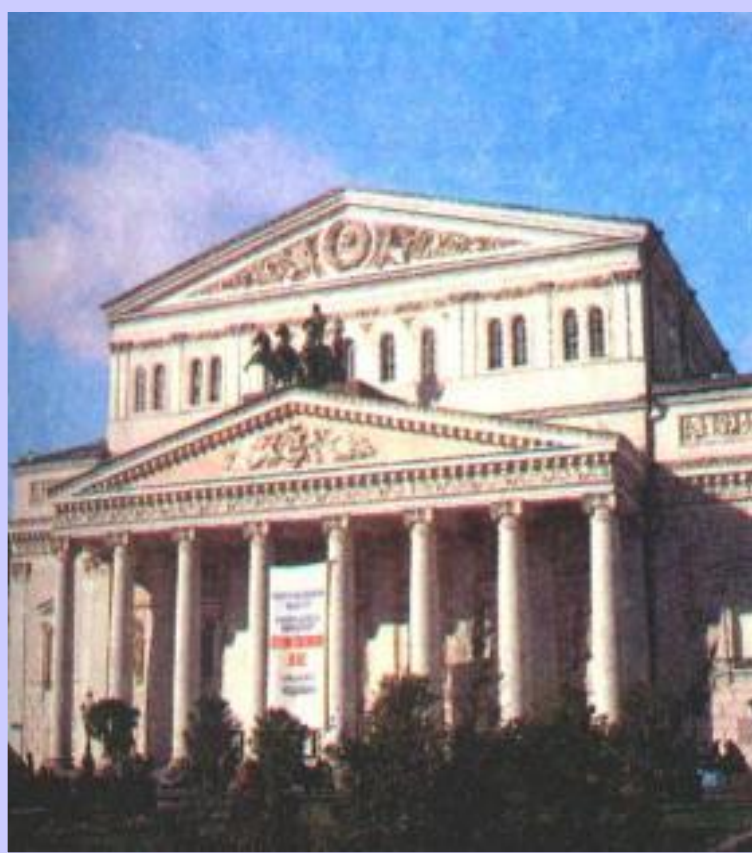
О.Бове Большой театр.

В Москве в стиле ампира выполнены работы О. Бове (реконструированная красная площадь, Большой театр,) Д. Жилярди (здание Московского университета).