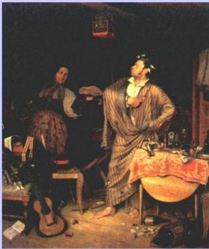
П.А.Федоров. Свежий кавалер.

Основоположником критического реализма в живописи стал П. Федоров, поднимавший в своих картинах социальные проблемы. В его «Свежем кавалере», чувствуется драматизм ситуации, критическое отношение автора к действительности и