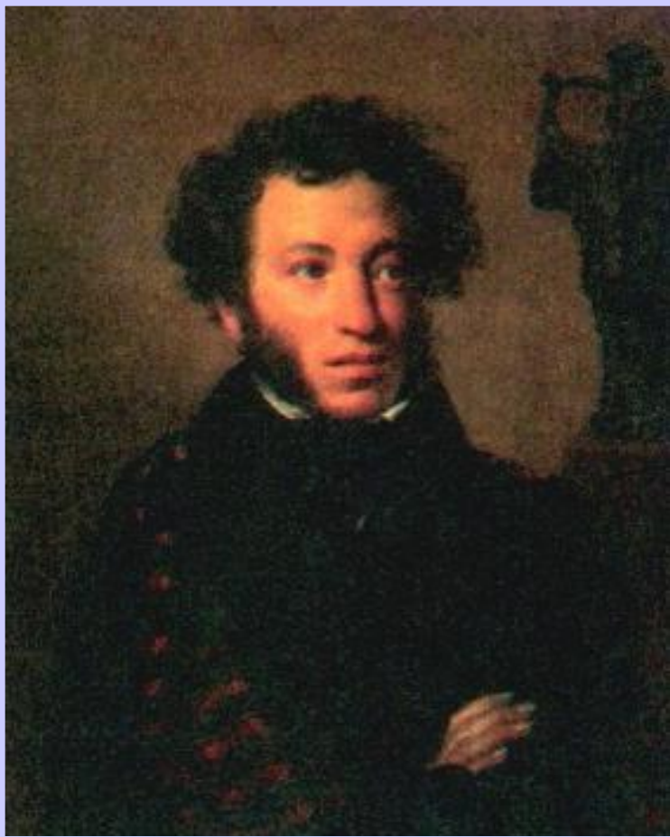
О.Кипренский Портрет А.С.Пушкина

В к. 20-х гг.наметился переход к новому направлению- реализму. Он проявился уже в трудах «позднего» Пушкина-«Борисе Годунове»,«Капитанской дочке», «Дубровский»,«Медный всадник», и в романе М.Лермонтова «Герой нашего времени».