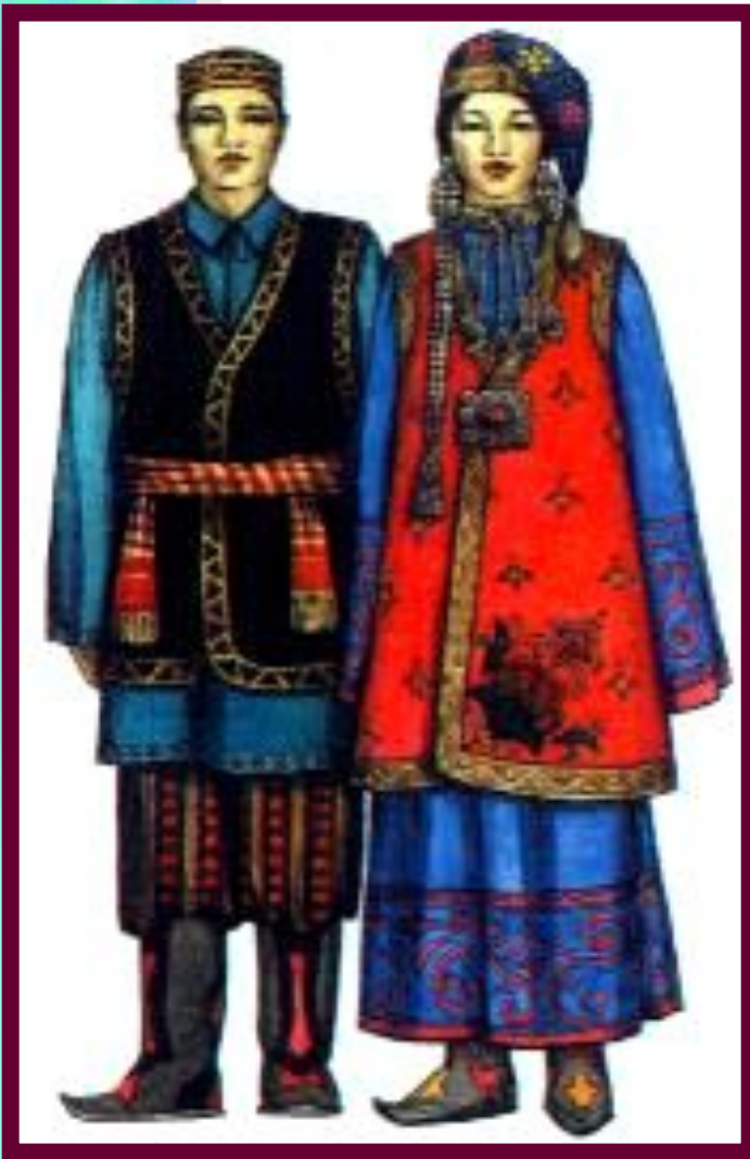
Татарский национальный костюм.

Покорение Поволжья и Приуралья завершилось в 17 в. Здесь возникли города (Уфа, Самара), прикрывавшие центр от набегов кочевников.