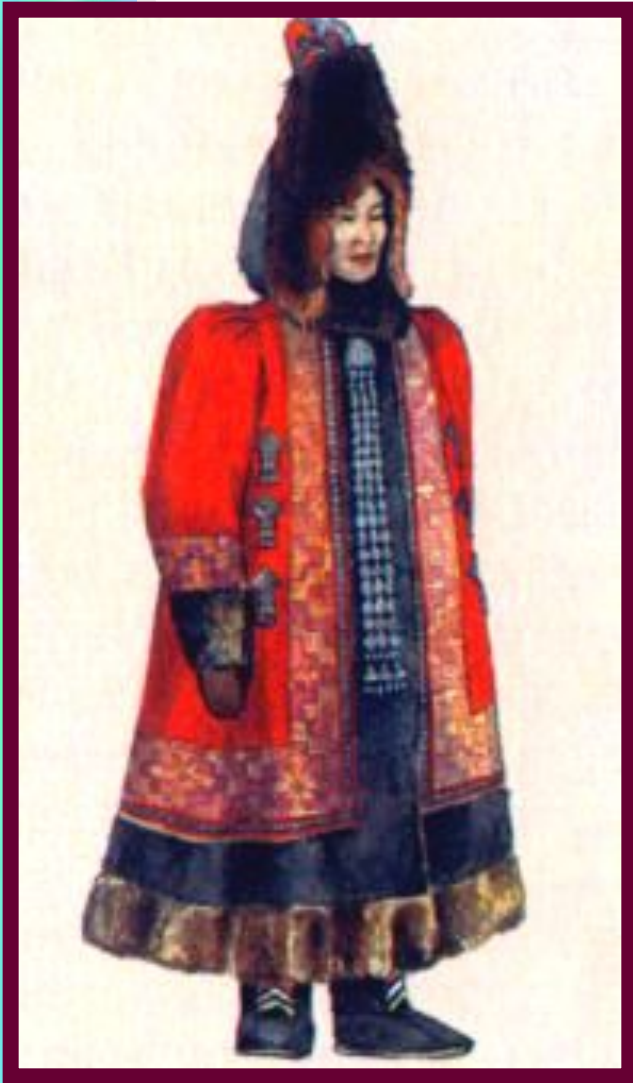
Якутская женщина в зимнем национальном костюме.

У Байкала жили буряты, разводившие крупный рогатый скот и занимавшиеся земледелием. Просо, гречиху и ячмень они обменивали у тунгусов на пушнину. В 17 в. у бурятов зарождается знать.