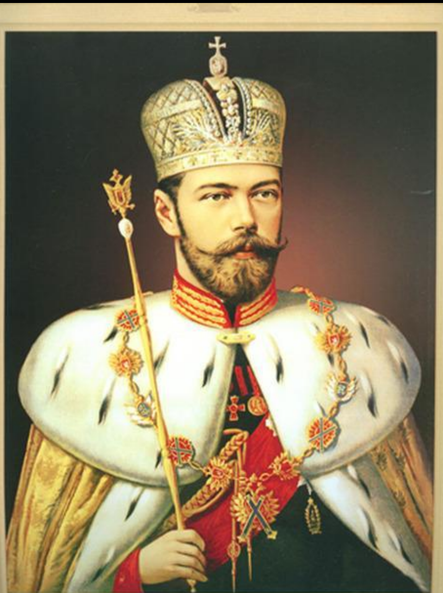
Его Императорское Величество Государь Император НИКОЛАЙ АЛЕКСАНДРОВИЧ.

На престол вступил император Николай II. Вдовствующая императрица нередко относилась критически к политике своего сына, но не стремилась оказывать прямого влияния на государственные дела.