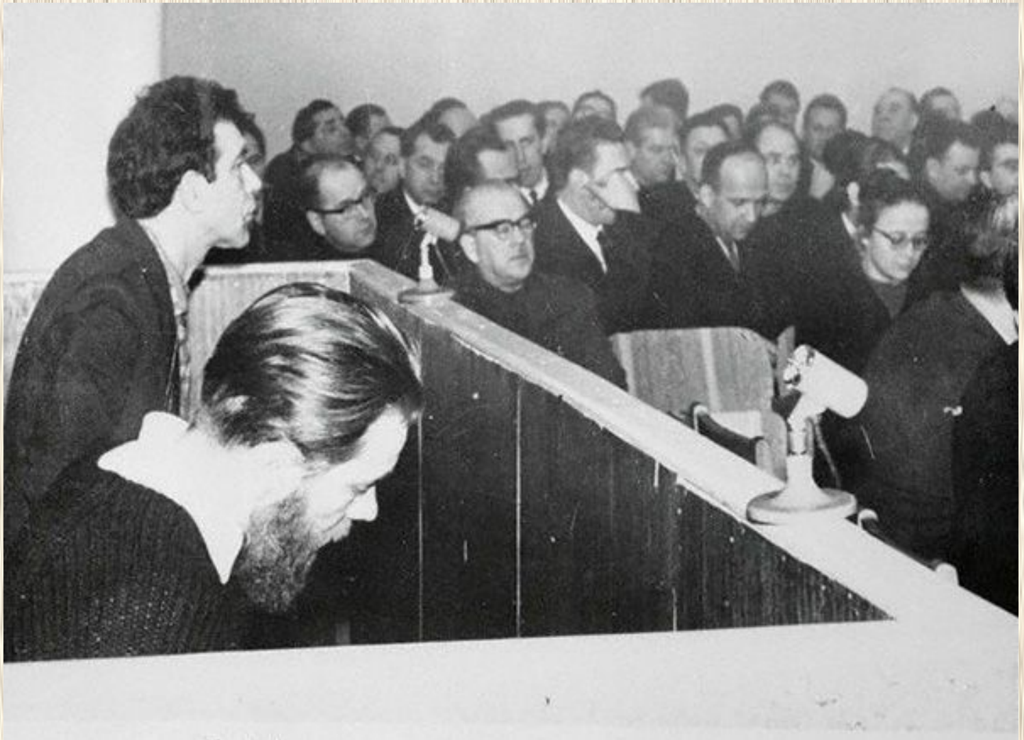
Судебный процесс против писателей А. Д. Синявского и Ю. М. Даниэля