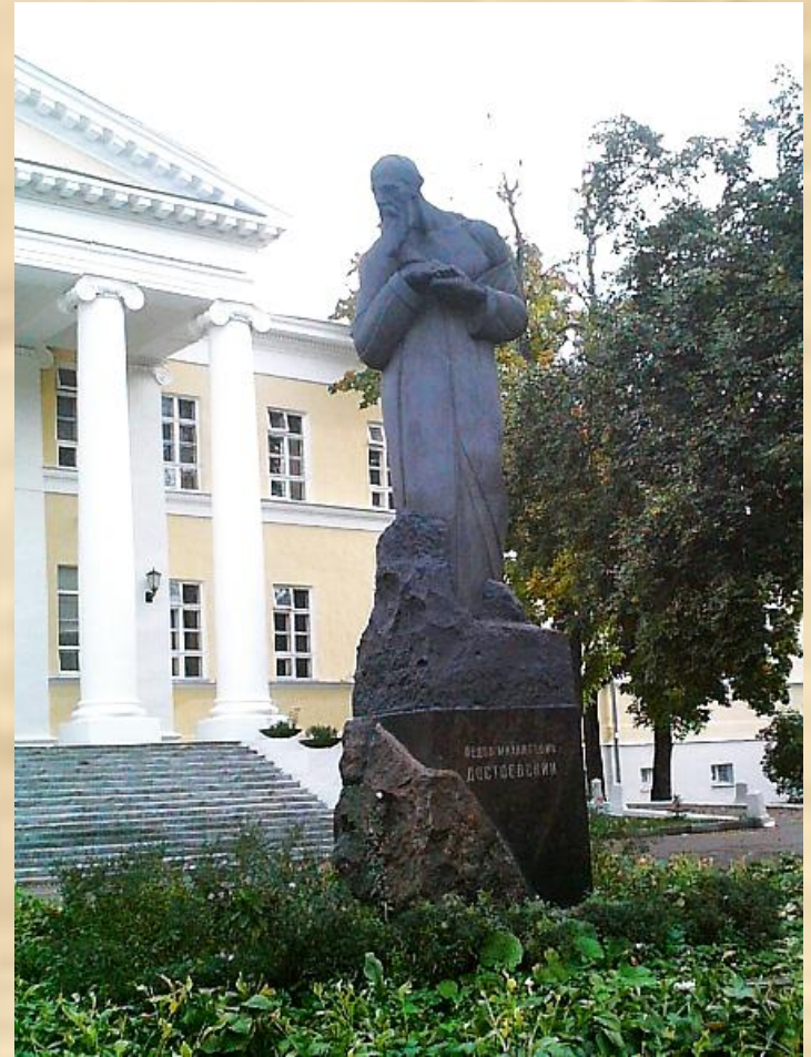
Памятник Достоевскому в Москве, рядом с местом рождения