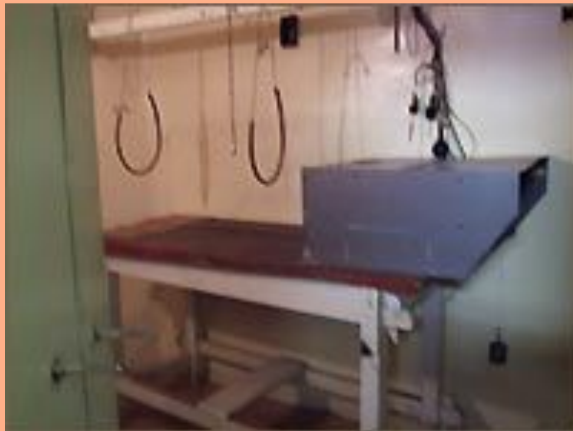
Камера в башне Молчания

Подача условных раздражителей производилась путем нажатия клавиш специального пульта. подача подкрепления производилась путем нажатия на баллон, соединенный резиновой трубкой с механизмом, обеспечивающим поворот чашек в кормушке с мясо-сухарным порошком. Наблюдение за поведением собаки производилось через перископ.