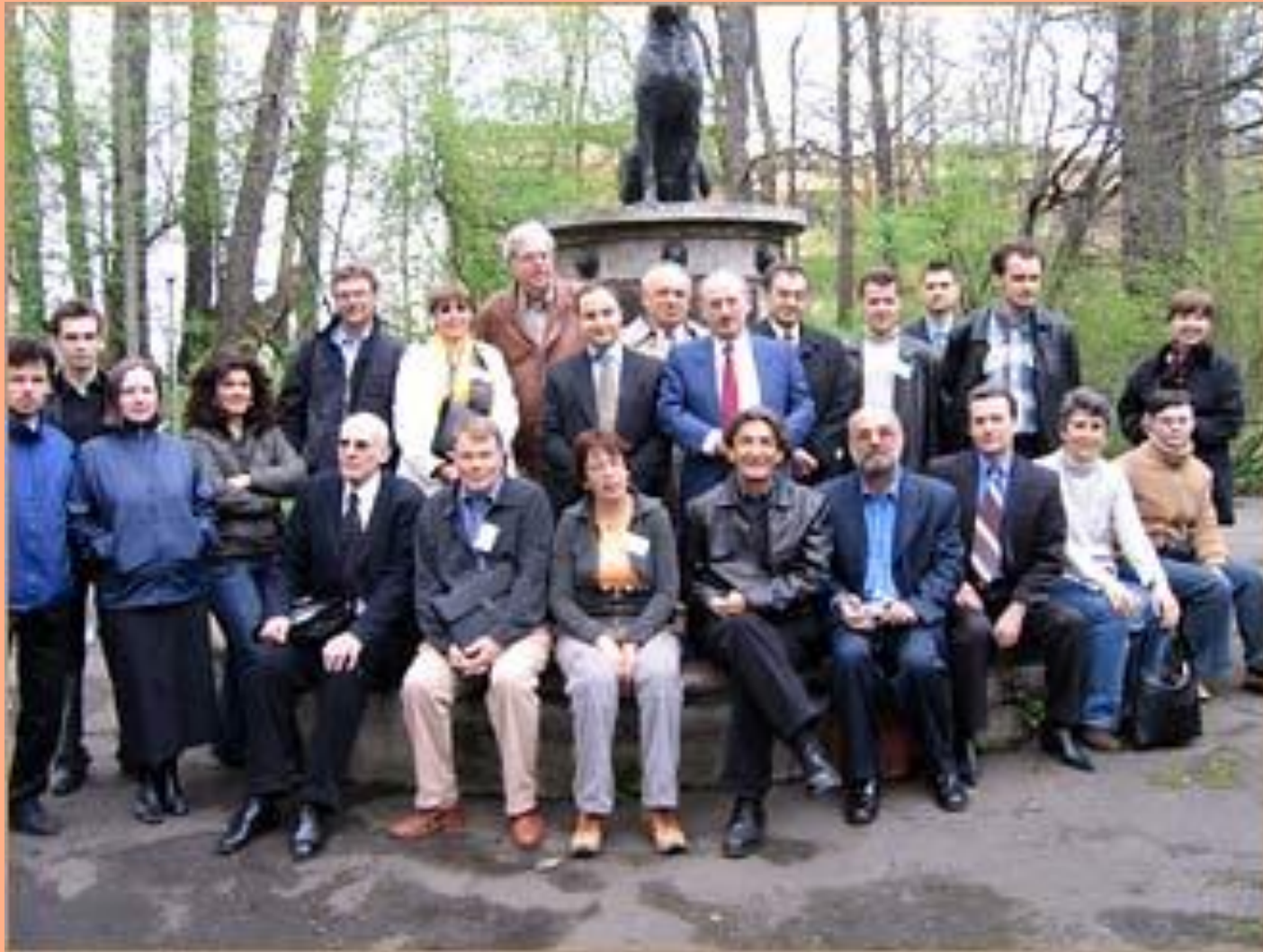
Участники 9 международной конференции "Стресс и поведение", Санкт-Петербург, 2005, перед памятником собаке.