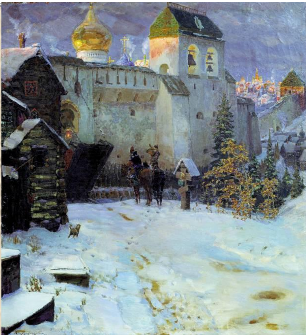
А.М. Васнецов «Древнерус ский город»