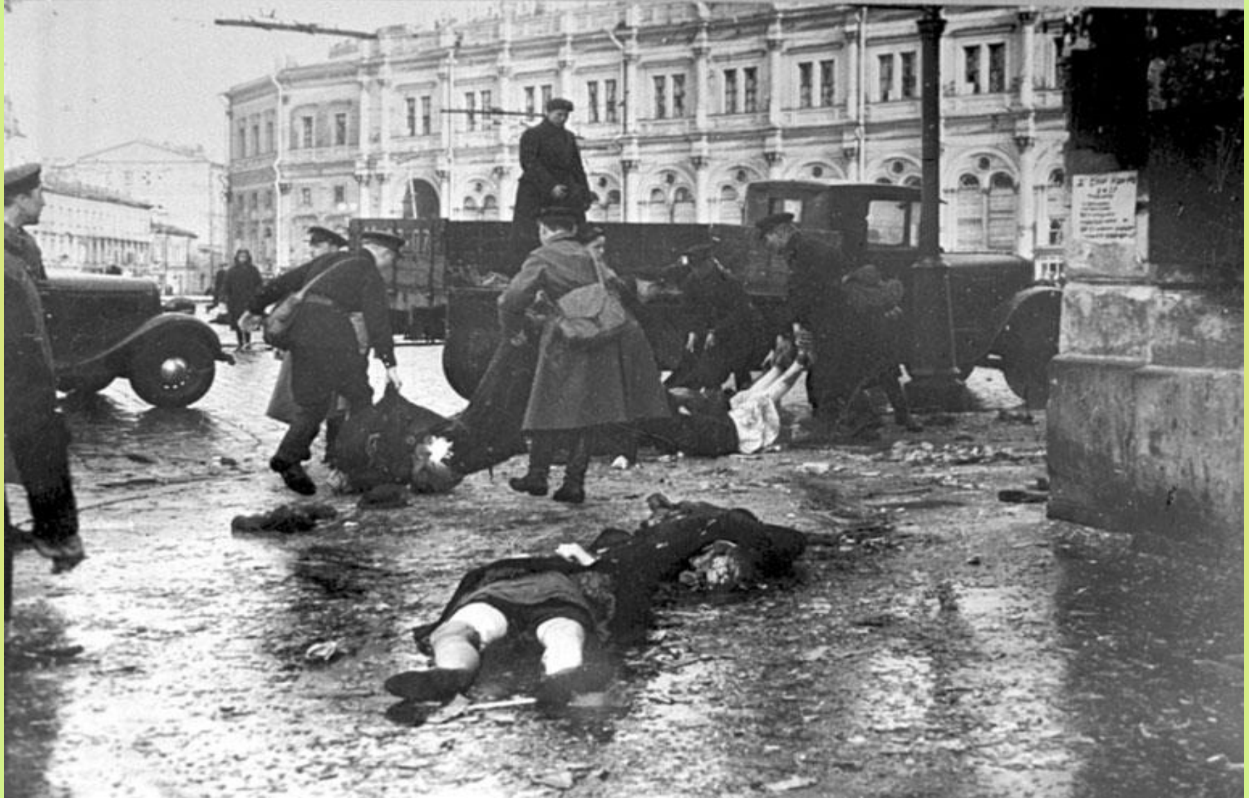
Октябрь 1941 г. Место съемки: г. Ленинград