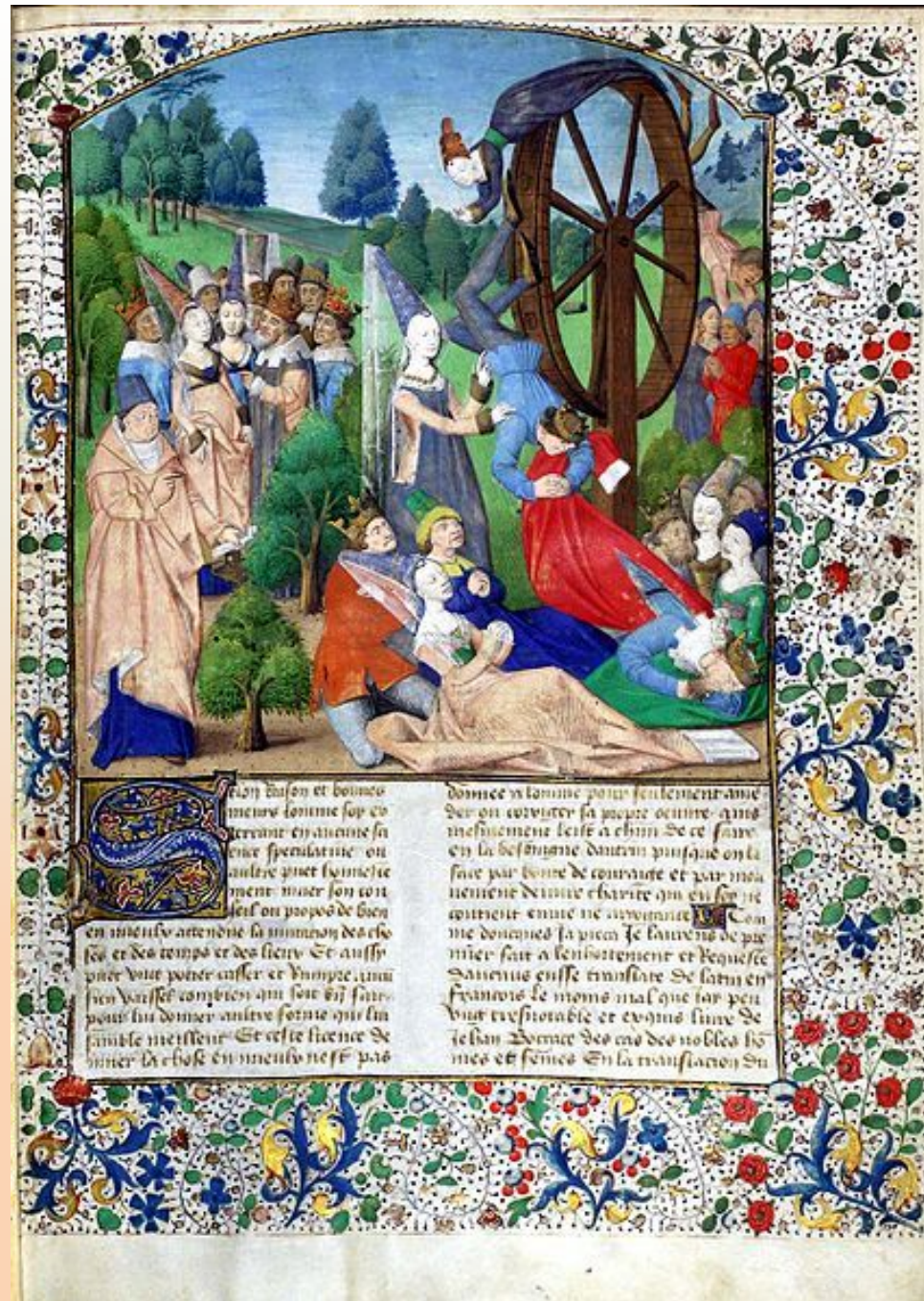
Иллюстрация к книге Боккаччо «О несчастиях знаменитых людей»: Фортуна крутит колесо удачи. Париж, 1467