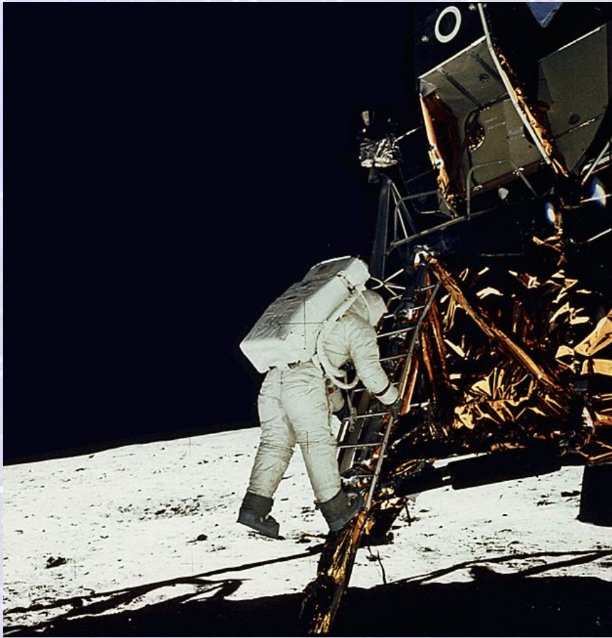
Нейл Армстронг делает первый шаг на Луну

Итак, 20 июля 1969 года в 20:17 по Гринвичу американский корабль "Аполлон-11" совершил мягкую посадку на поверхность Луны. Впервые человек ступил на поверхность другого небесного тела.