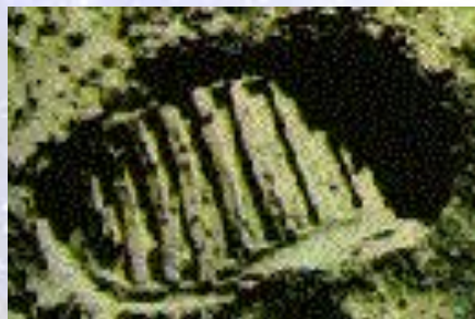
След Эдвина Олдрина на лунной поверхности имел глубину менее 2,5 см.

На фотографии лунного ландшафта, полученной "Аполлоном-11", видно несколько деталей поверхности, представших взору космонавтов. По лунным стандартам эта область считается ровной.