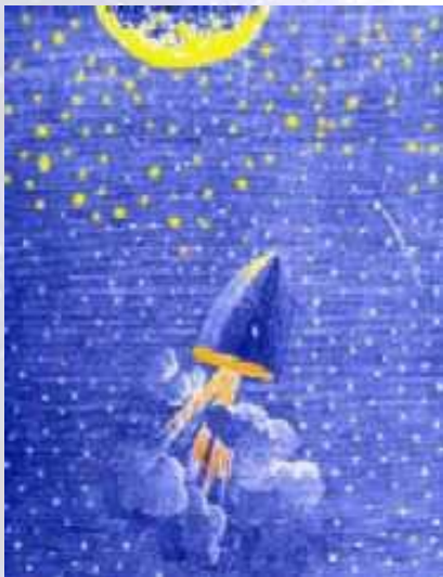
Одна из первых иллюстраций к книге Жюль Верна "Из Пушки на Луну".

примеру, он дал настолько точные оптические характеристики (длина тени и т. д.), что создается впечатление, будто измерения ученый проводил там. В своем труде Кеплер назвал двенадцать наук, освоение которых может дать человеку возможность подняться в космос и достичь Луны.