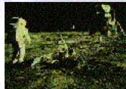
На снимке показано место прилунения "Аполлона-11"

Во время полета "Аполлона-11" Армстронг и Олдрин установили лунный сейсмометр, подобный тем, что используются на Земле, но более чувствительный, поскольку Луна-сейсмически "спокойна". Аппарат быстро вышел из строя, но аналогичный приборы, установленные другими экспедициями "Аполлонов" показали, что слабые сейсмические колебания на Луне наблюдаются часто.