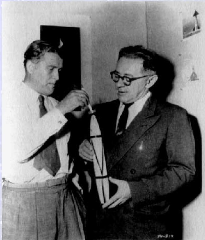
Вернер фон Браун (слева)

Этот управляемый снаряд, применялся на последнем этапе второй мировой войны для обстрела городов Великобритании и Бельгии. "Фау-2"-прямой предшественник современных американских космических ракет, так как после окончания войны большинство немецких специалистов в этой области продолжили свою работу в США. С 1945 г. Вернер фон Браун тоже работал в США, где под его руководством были разработаны ракеты "Редстоун", "Юпитер", серии ИСЗ "Эксплорер", ракет-носителей "Сатурн", космический корабль "Аполлон".