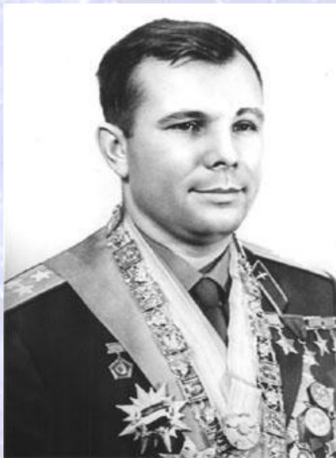
Юрий Алексеевич Гагарин

Весь мир знает имя первого человека, совершившего полет в космос - это Юрий Гагарин. Юрий Алексеевич Гагарин (1936-1968) - летчик-космонавт СССР, полковник, Герой Советского Союза. Окончил Военно-воздушную инженерную академию им. Н.Е.Жуковского. Юрий Гагарин участвовал в обучении и тренировке экипажей космонавтов. Он является почетным членом Международной академии астронавтики. Погиб во время тренировочного полета на самолете. Именем Гагарина назван кратер на обратной стороне Луны. 12 апреля 1961 г. он впервые в истории человечества совершил полет в космос на космическом корабле "Восток". Облетев земной шар, он через 1 час 48 минут благополучно приземлился в заданном районе Советского Союза. День первого в истории космического полета - 12 апреля 1961 года – теперь отмечается как День космонавтики. На подобных одноместных кораблях позже летали и другие космонавты.