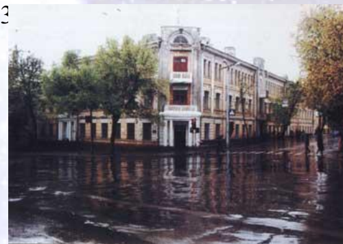
Общеобразовательная школа № 6, в которой в 1918-1921 гг. преподавал К.Э.Циолковский.

Итак, К.Э.Циолковский, великий русский ученый, был простым учителем средней школы в Калуге. Его научные интересы распространялись от натурфилософии до авиации, дирижаблестроения и ракетной техники.