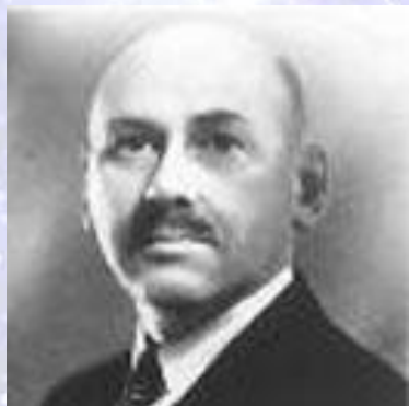
Роберт Хатчингс Годдард

Идея исследования и освоения космического пространства захватила и одного из пионеров ракетной техники, талантливого отечественного ученого Фридриха Артуровича Цандера (1887-1933) . Еще в юношеские годы он познакомился с работой К. Э. Циолковского «Исследование мировых пространств реактивными приборами», увлекся ракетостроением и космонавтикой и посвятил им всю свою жизнь. Ф. А. Цандер вошел в историю науки как энтузиаст, страстный пропагандист идей космических полетов, начавший практическую работу в области космонавтики. В 1921 г. Ф. А. Цандер представил московской конференции изобретателей свой проект межпланетного корабля-аэроплана.