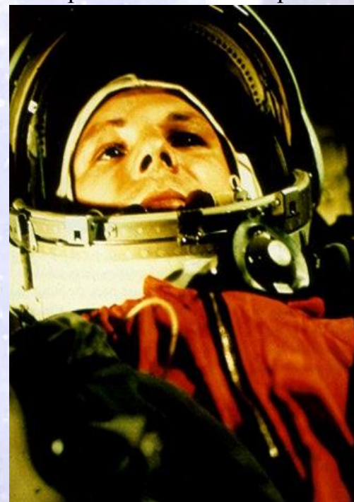
Юрий Алексеевич Гагарин