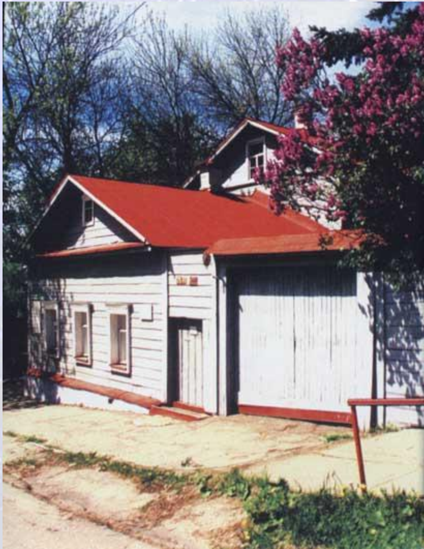
Мемориальный дом-музей К.Э. Циолковского.

Слава пришла к Циолковскому лишь в последние годы жизни. В Калуге – городе, где жил Циолковский, – теперь открыт его музей.