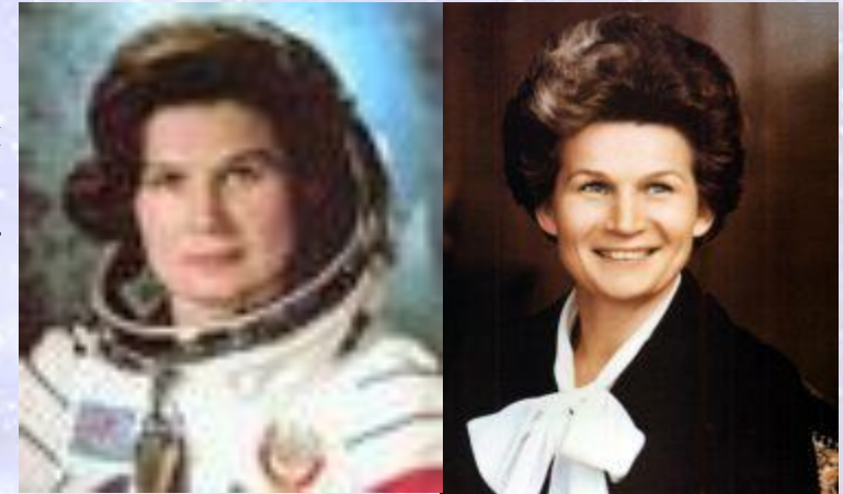
Валентина Владимировна Терешкова

А вслед за ним был выпущен корабль-спутник «Восток-6», пилотируемый первой в мире женщиной-космонавтом Валентиной Владимировной Терешковой . Первая в мире женщина-космонавт пробыла в космосе 71 час и совершила 48 оборотов вокруг Земли. Своим полетом она убедительно доказала равные возможности женщины в таком трудном и сложном деле, каким является освоение космоса.