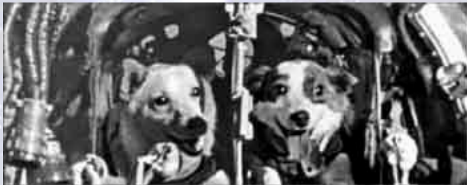
Белка и Стрелка