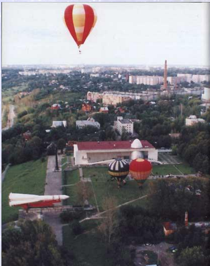
Государственный музей истории космонавтики им. К.Э. Циолковского. Вид с воздушного шара.

В 1911 году Циолковский произнес свои вещие слова: «Планета есть колыбель разума, но нельзя вечно жить в колыбели... Человечество не останется вечно на Земле, но в погоне за светом и пространством сначала робко проникнет за пределы атмосферы, а затем завоюет себе все околосолнечное пространство».