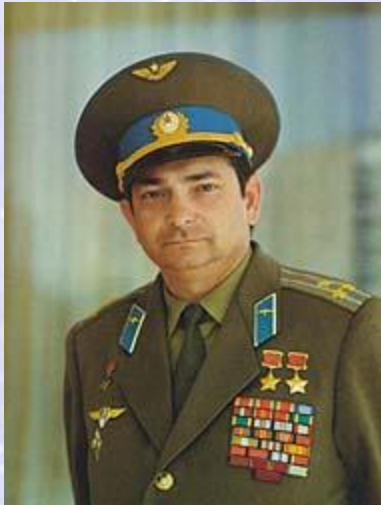
Валерий Федорович Быковский

А вслед за ним был выпущен корабль-спутник «Восток-6», пилотируемый первой в мире женщиной-космонавтом Валентиной Владимировной Терешковой . Первая в мире женщина-космонавт пробыла в космосе 71 час и совершила 48 оборотов вокруг Земли. Своим полетом она убедительно доказала равные возможности женщины в таком трудном и сложном деле, каким является освоение космоса.