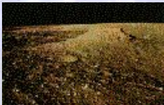
Фотография лунного ландшафта

При исследовании Луны по программе "Аполлон" использовалась ракета "Сатурн", несшая лунный, командный и служебный модули. Лунная самоходная тележка находилась на трех "Аполлонах" (15,16,17) и использовалась астронавтами для передвижения по поверхности Луны на значительные расстояния. Ее скорость составляла 8-16 км/ч.