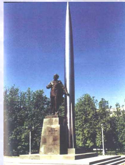
Калуга. Памятник К.Э. Циолковскому в сквере Мира.