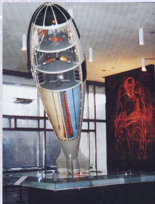
Зал научной биографии К.Э. Циолковского ГМИК.

Своими работами К. Э. Циолковский во многом определил рациональные пути развития космонавтики и ракетостроения.