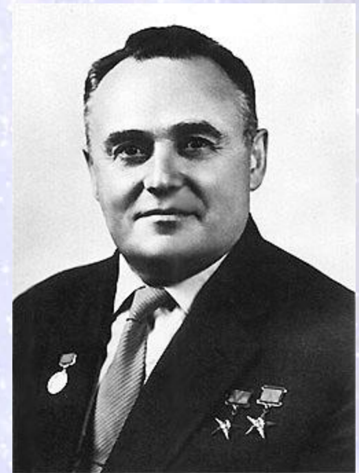
Сергей Павлович Королев

У нас создание ракетной и космической техники возглавил Сергей Павлович Королев (1907-1966) , советский конструктор первых ракетно-космических систем, основоположник практической космонавтики, академик Академии наук СССР. Под руководством С.П. Королева созданы баллистические и геофизические ракеты, искусственные спутники земли, спутники различного направления ("Электрон", "Молния-1", "Космос", "Зонд" и др.), космические корабли "Восток", "Восход", на которых впервые в истории совершены космические полеты человека и выход в космос.