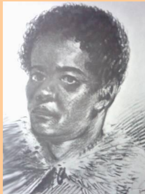
А. Орловский. Портрет негра.