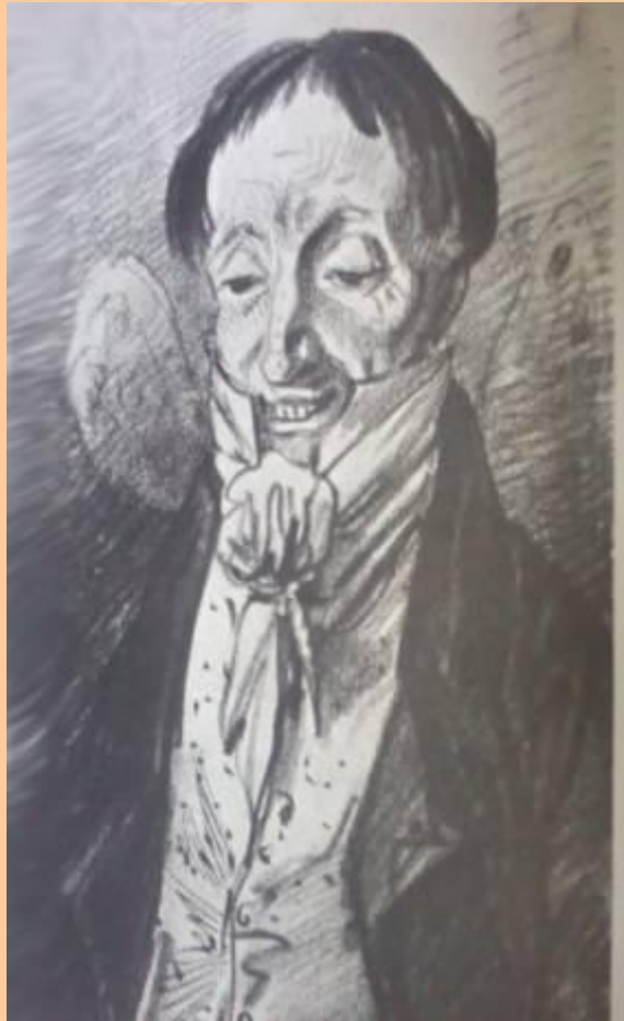
А. Орловский. Портрет Ш. Л. Дидло.

■ Уже сам размер небольшого портрета делал его ближе к зрителю, оставляя его наедине с изображением, а тем самым и с изображенным человеком, призывая пристальнее всмотреться в его облик, проникнуть чувством в его душевное состояние.