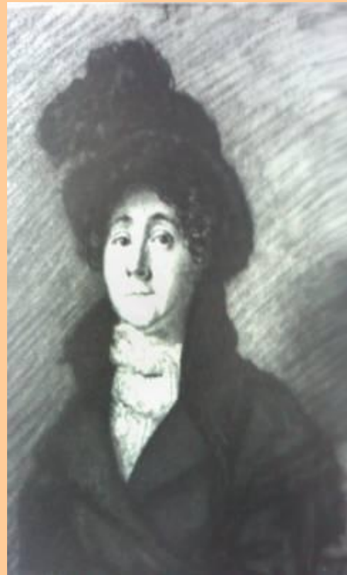
О.Кипренский. Портрет Вилло.