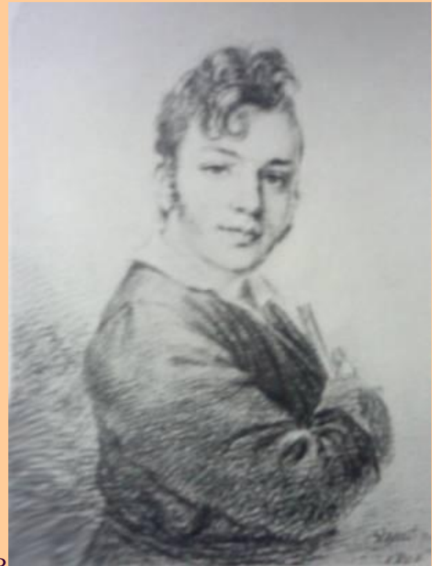
А. Венецианов. портрет м.п. годзянко.