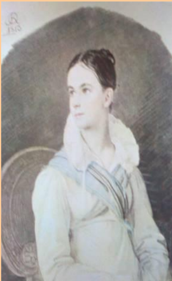
Экспрессионный портрет Кочубей.