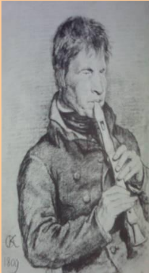
О.Кипренский. Портрет музыканта.