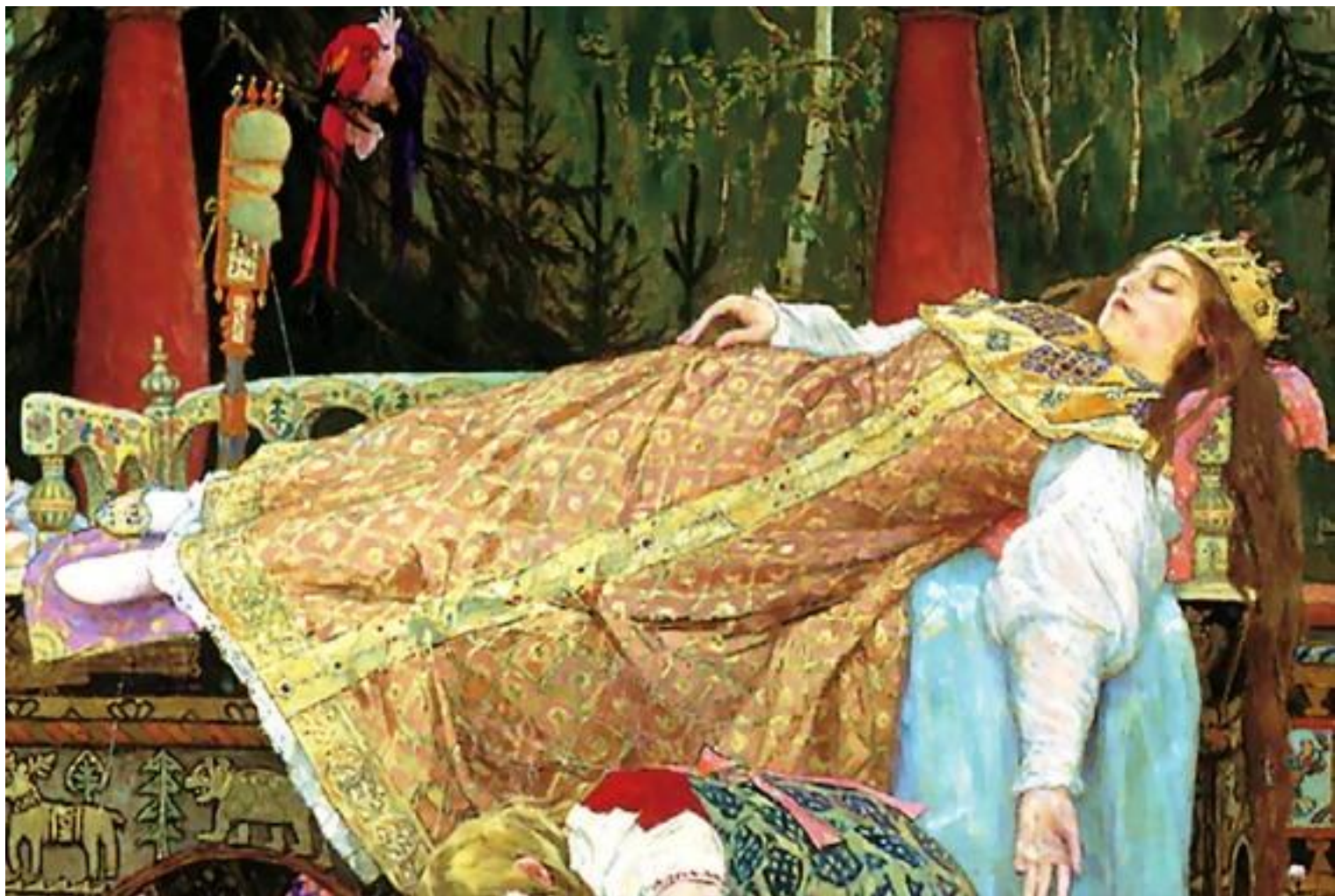
В.Васнецов «Спящая царевна»