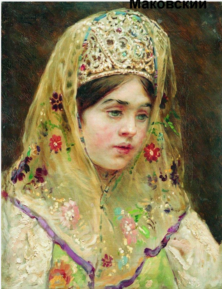
Девушка в русском костюме