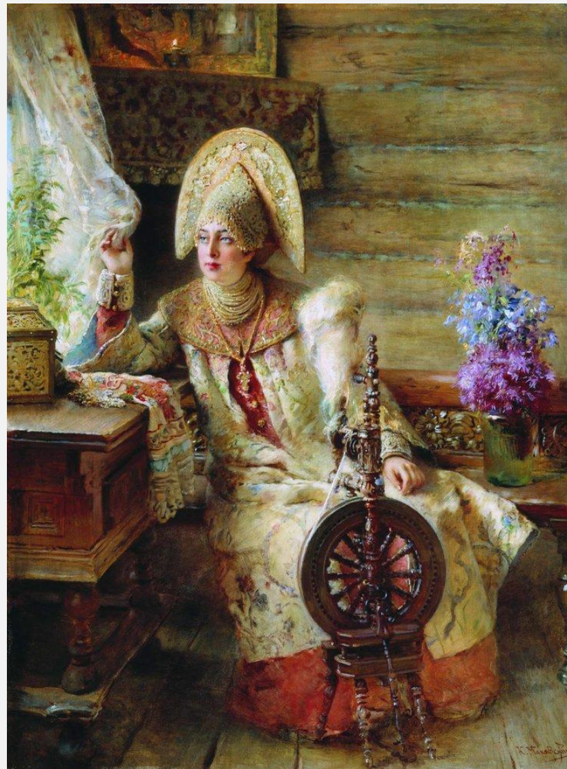
Боярыня у окна с прялкой