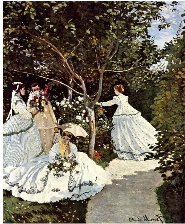
Женщины в саду Год создания 1867