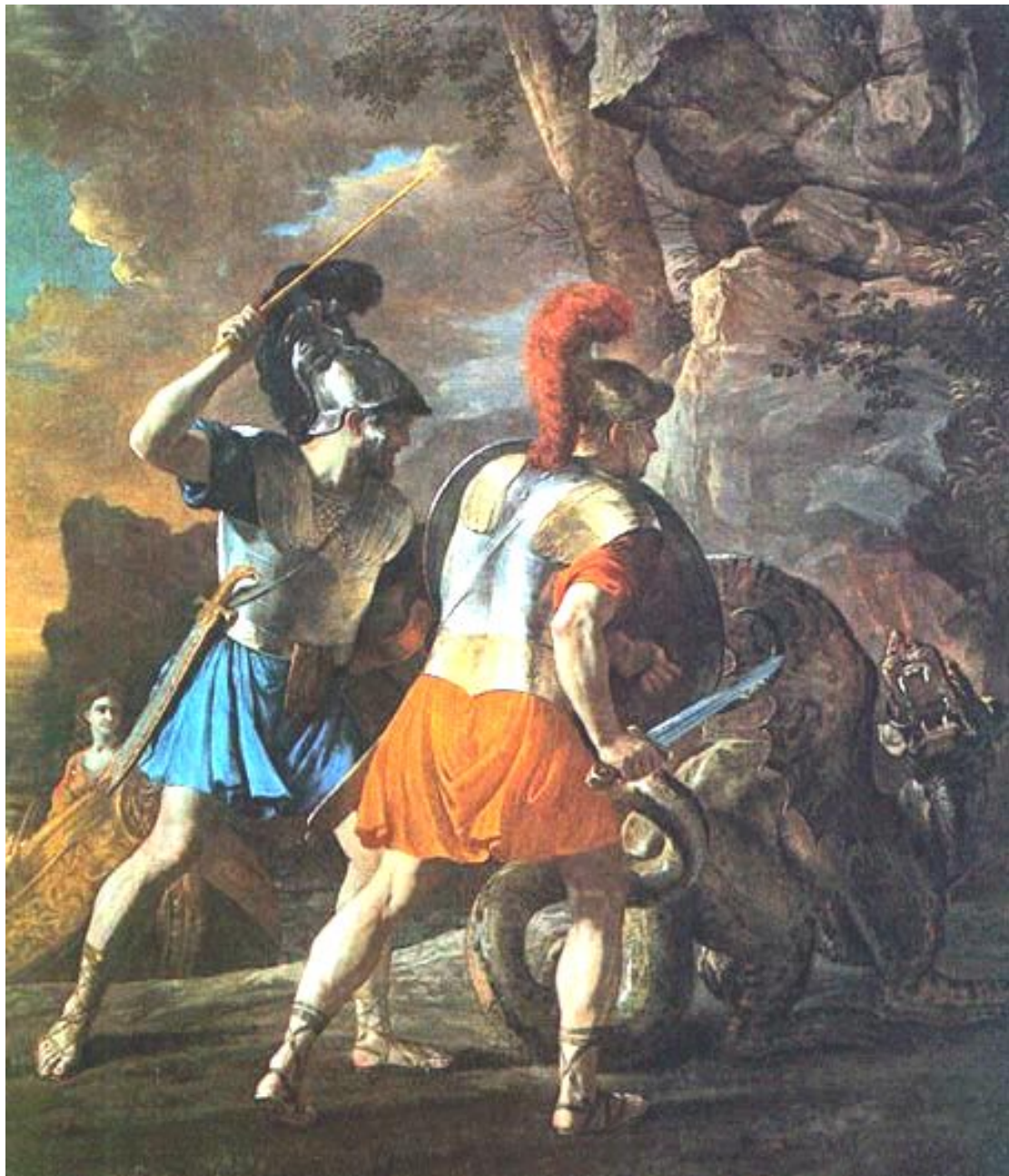
Поединок Ринальдо 1628