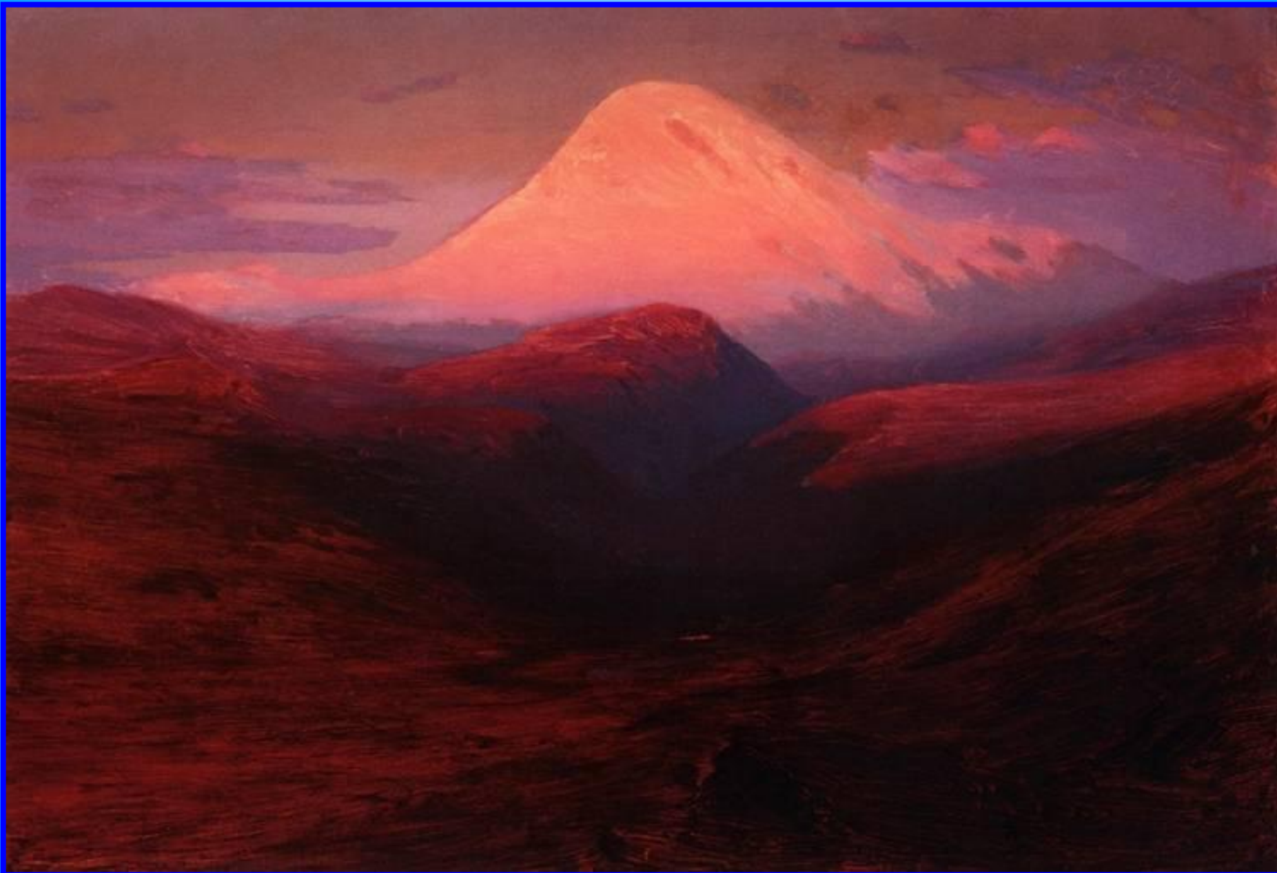
Эльбрус на закате