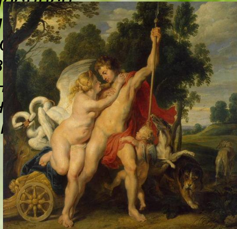
Рубенс. Венера и Адонис.