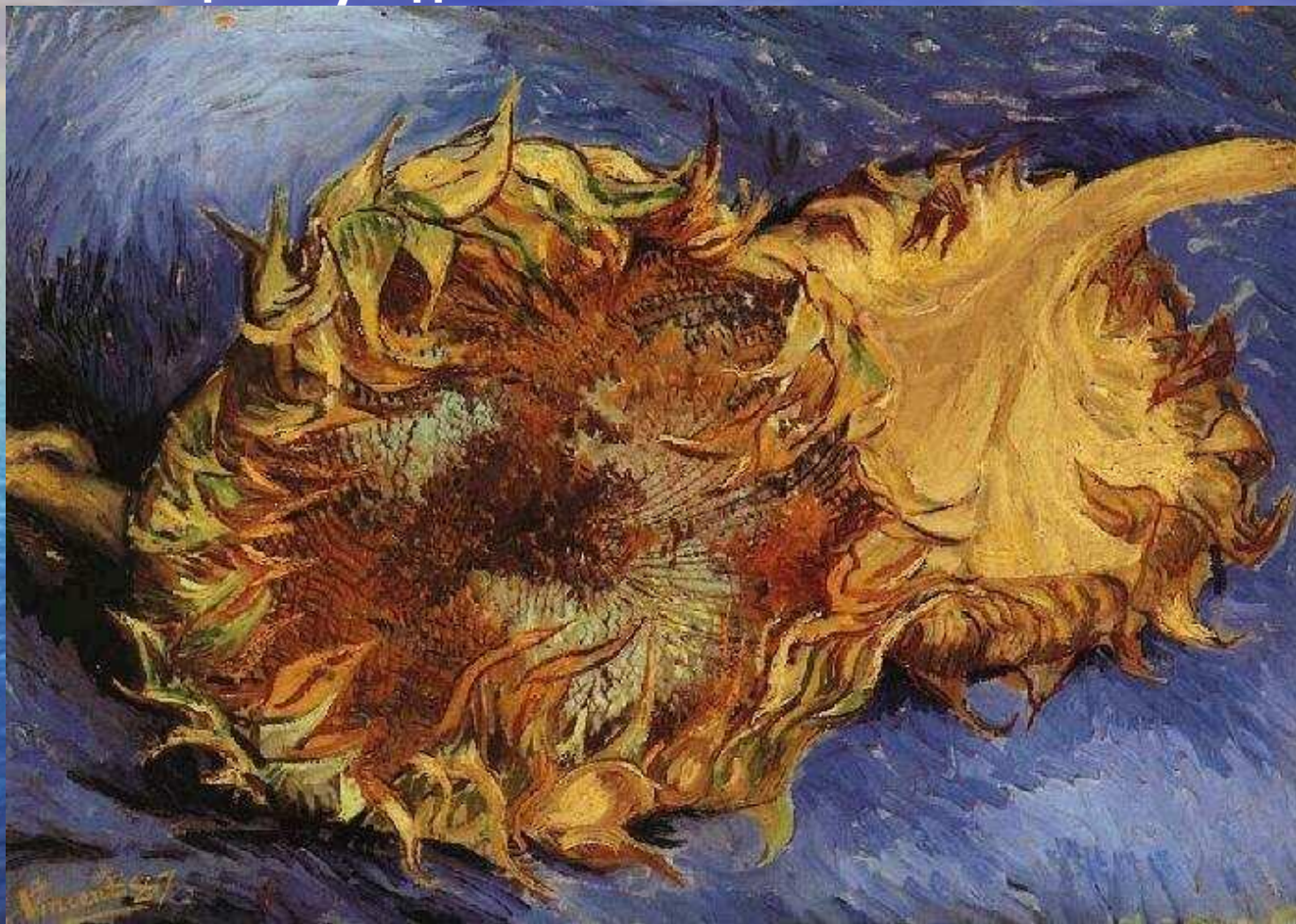
Два срезанных подсолнуха. Париж, сентябрь 1887. Холст, масло, 42х61. Музей Метрополитен, Нью-Йорк, США

Примятые, теряющие упругость лепестки похожи на взъерошенную шерсть или на языки гаснущего пламени, черные сердцевины – на огромные скорбные глаза, стебли – на судорожно изогнувшиеся руки. От этих цветов веет печалью, но в них еще дремлет жизненная сила, сопротивляющаяся увяданию.