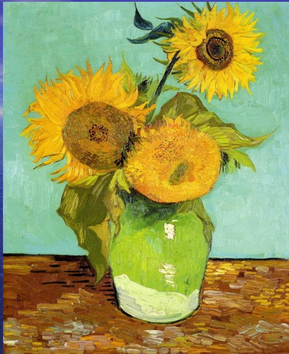
Три подсолнуха в вазе. Арль, август 1888. Холст, масло, 73x58. Частное собрание, США

Ван Гог живет на юге Франции, в Арле, где все приводит его в восторг: неистовое солнце, яркие краски, новое жилище, которое художник называет «желтым домиком» и о котором пишет Тео: «Снаружи дом выкрашен в желтый цвет, внутри выбелен, много солнца».