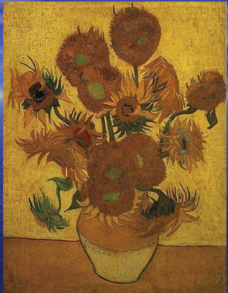
1888 г. Второй вариант, 95 × 73 см, Музей Ван Гога, Амстердам, Нидерланды