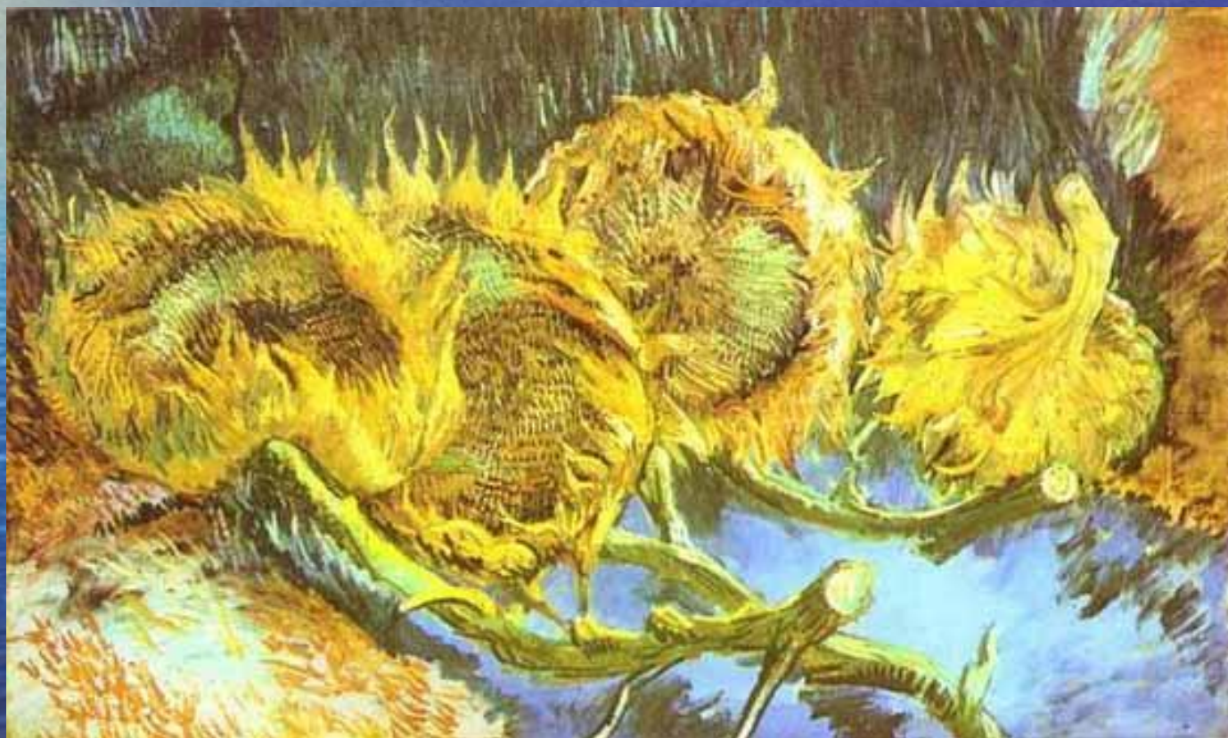
Четыре срезанных подсолнуха. Париж, сентябрь 1887. Холст, масло, 60x100. Отерло, Кроллер-Моллер Музей