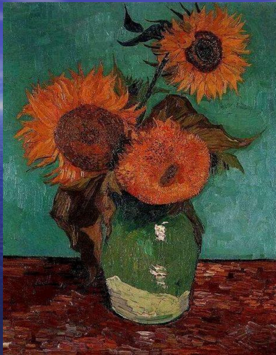
Первый вариант: бирюзовый фон, 73.5 × 60 см, частная коллекция ,август 1988г

● То же можно сказать и о фоне: это не драпировка, не стена, не воздушная среда, а просто некая покрашенная плоскость. Объемность вазы не подчеркнута, лишь цветы свободно живут в трехмерном пространстве — одни лепестки энергично тянутся вперед, к зрителю, другие устремляются в глубь холста.