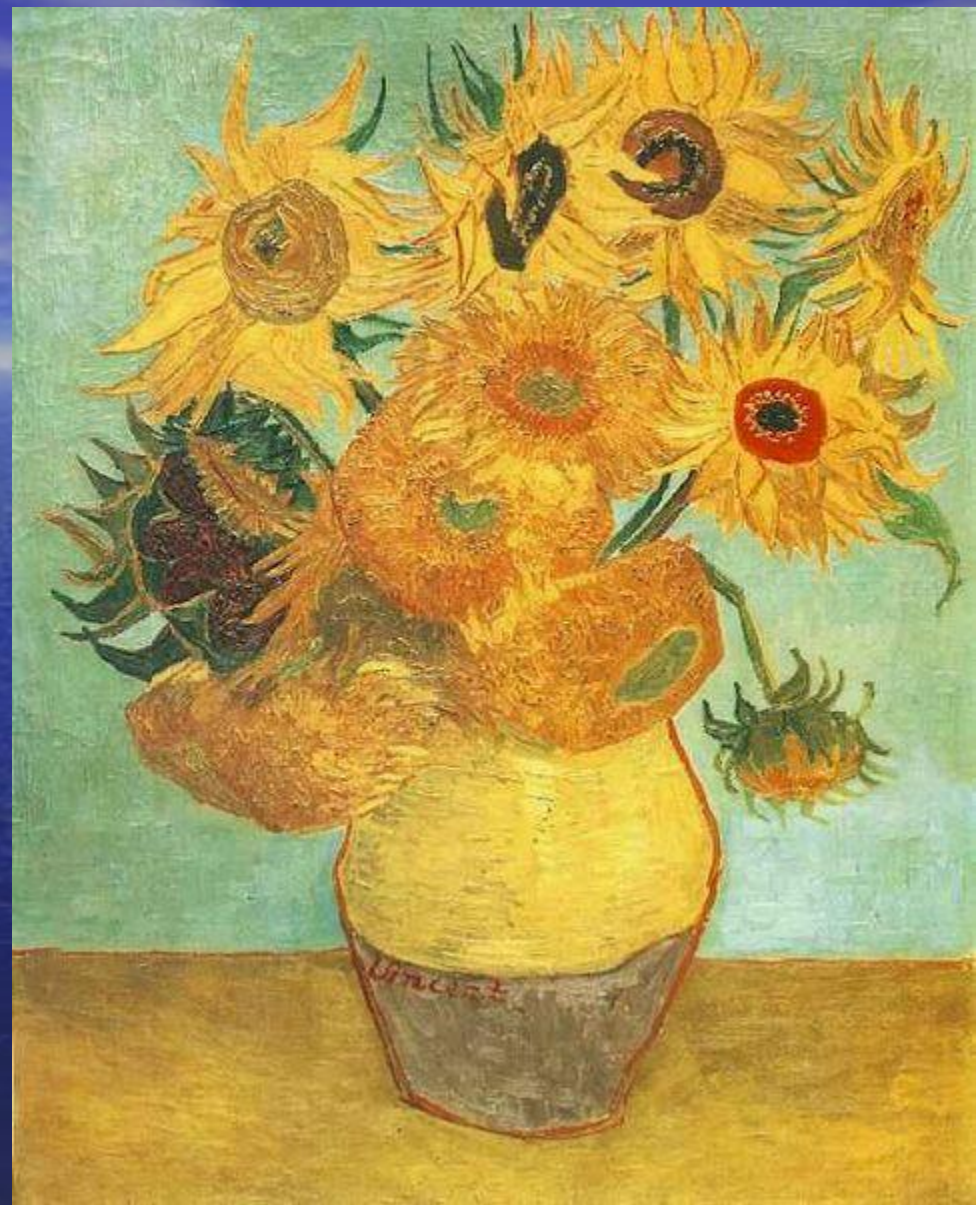
Первый вариант, 92 × 72.5 см, Филадельфийский Музей Искусств, США, август 1988г