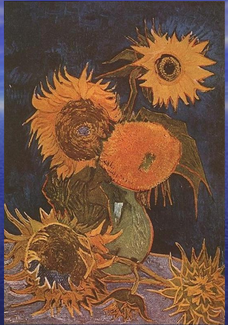
«Ваза с пятью подсолнухами»