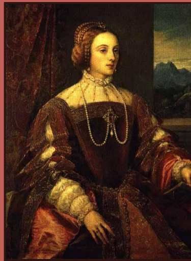
Тициан. Портрет Изабеллой Португальской