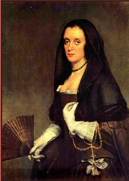
Веласкес. Портрет дамы с веером.

Вот откуда бесконечная вереница Мадонн, постепенно превращающихся просто в портреты молодых женщин эпохи, чья красота приобретает самодовлеющее значение.