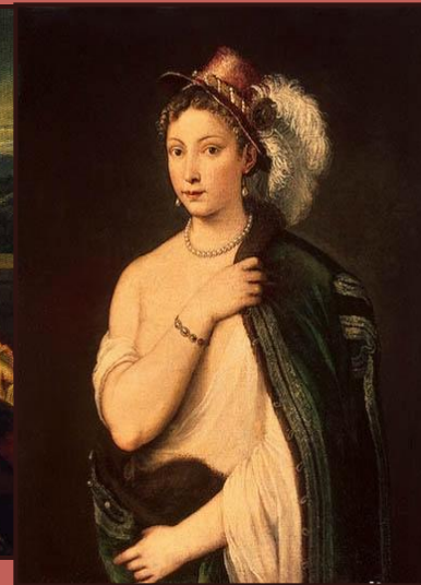
Тициан. Портрет молодой женщины