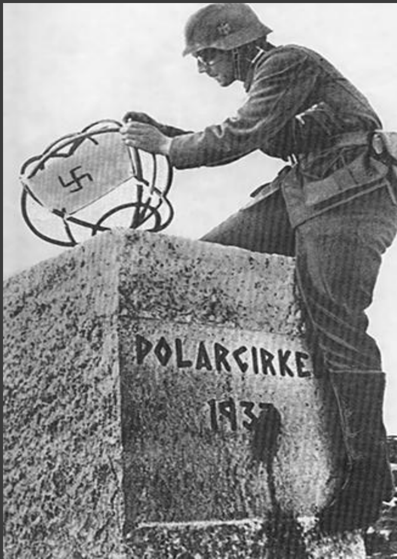
Немецкие войска в Норвегии