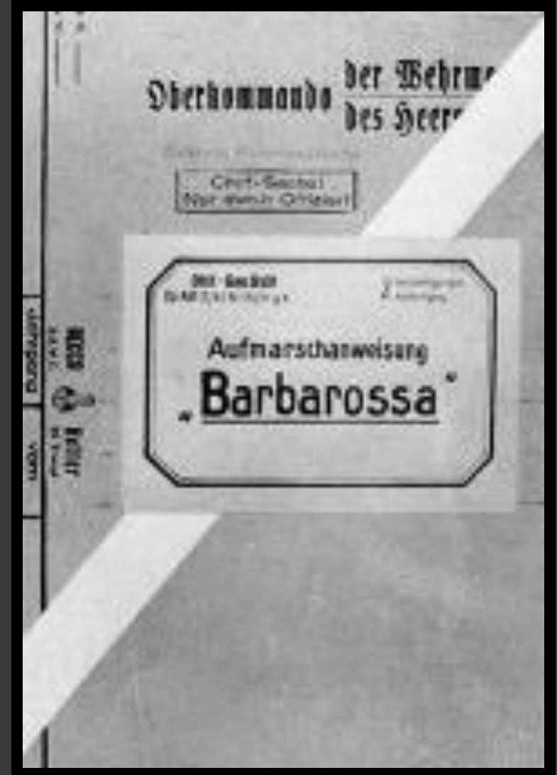
Папка с планом «Барбаросса».