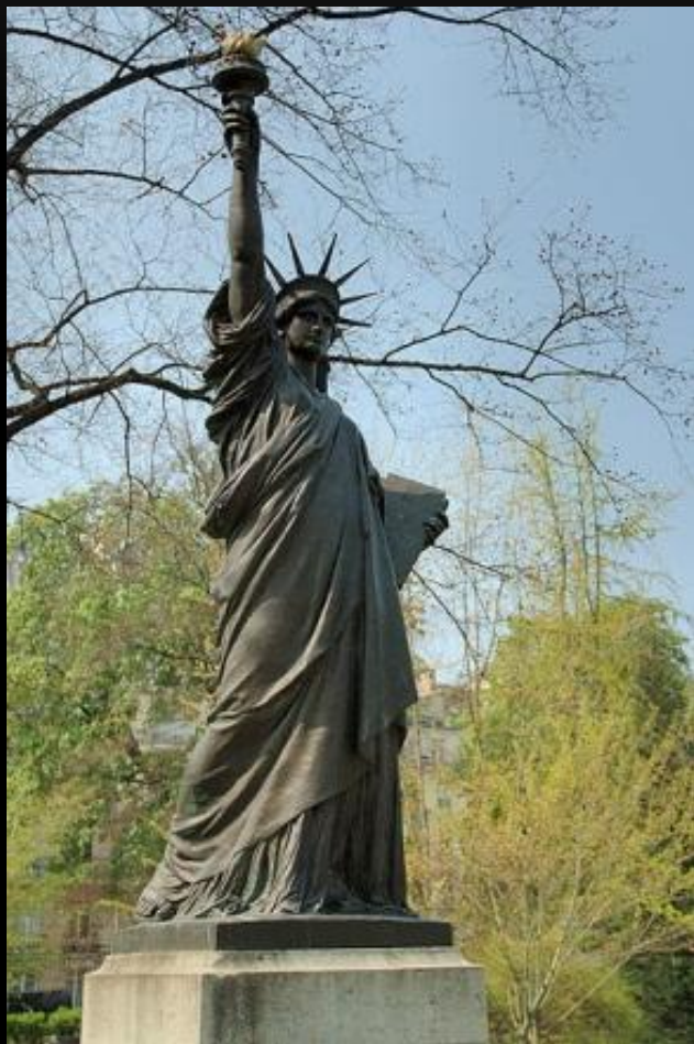
В Люксембургском саду