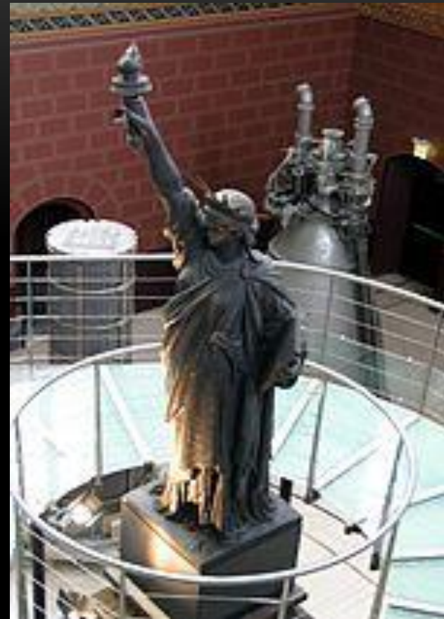
Экспонат парижского Музея искусств и ремёсел