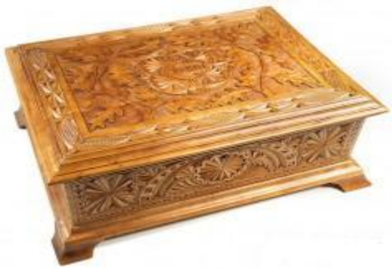
Деревянная резная шкатулка