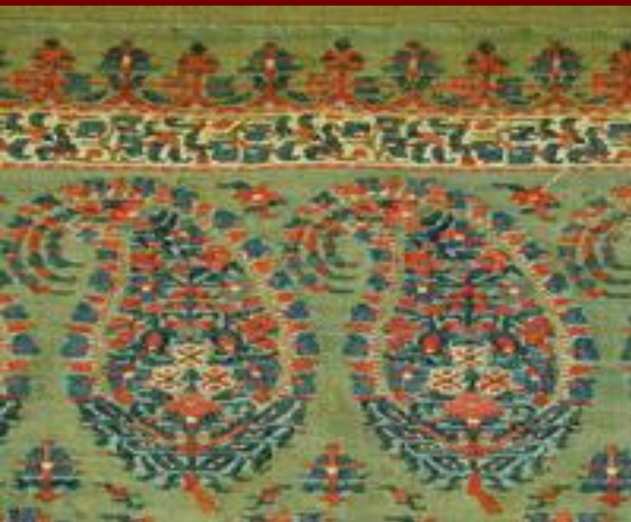
Шаль с огуречным рисунком