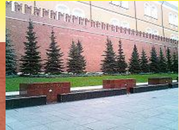
Обелиски городов-героев у Кремлевской стены

«Имя твое неизвестно – подвиг твой бессмертен»