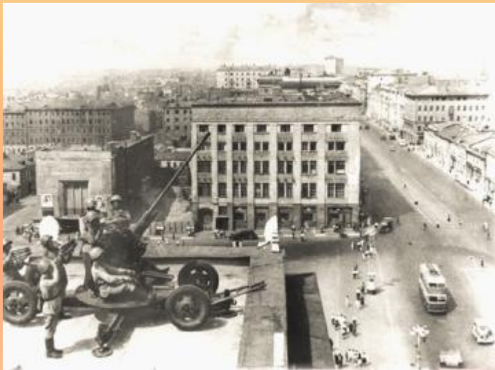
Зенитное орудие на одном из зданий на улице Горького