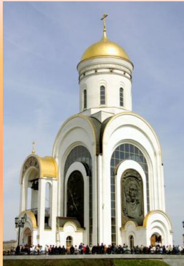
Храм Георгия Победоносца на Поклонной горе