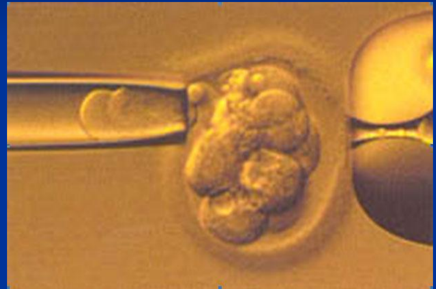
Биопсия бластомера эмбриона