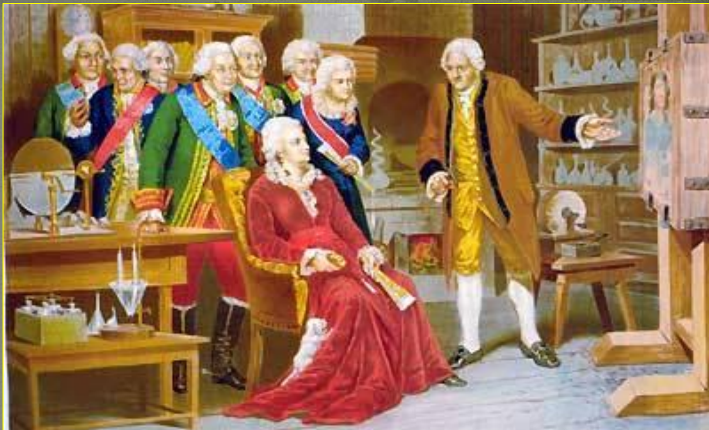
Ломоносов демонстрирует Екатерине II мозаику собственного изготовления. Репродукция полотна А.Д. Кившенко. 1895 г.