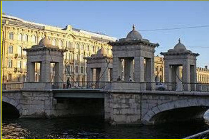
Мост Ломоносова через Фонтанку. Санкт-Петербург