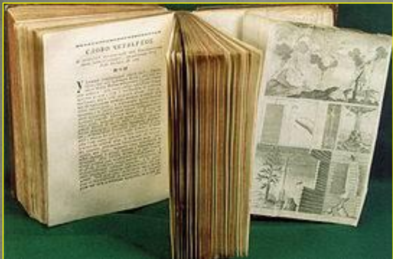
М. В. Ломоносов «Слово о явлениях воздушных...». 1753

«Введение в истинную физическую химию». Рукопись М. В. Ломоносова. 1752