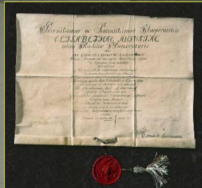
Диплом профессора химии Ломоносова. 1745. М. В. Ломоносов и В. К. Тредиаковский — первые русские академики.