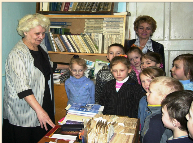
«Где прячется алфавит?»