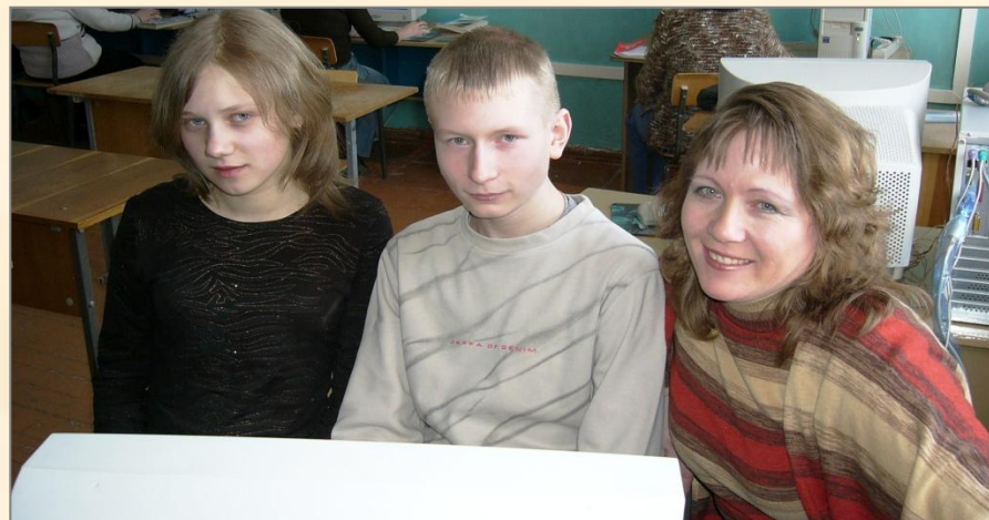
«Высший пилотаж языка»