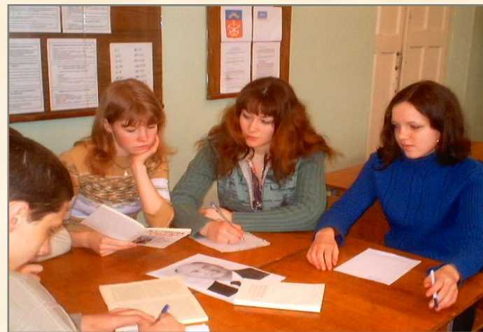
«Ломать не строить»