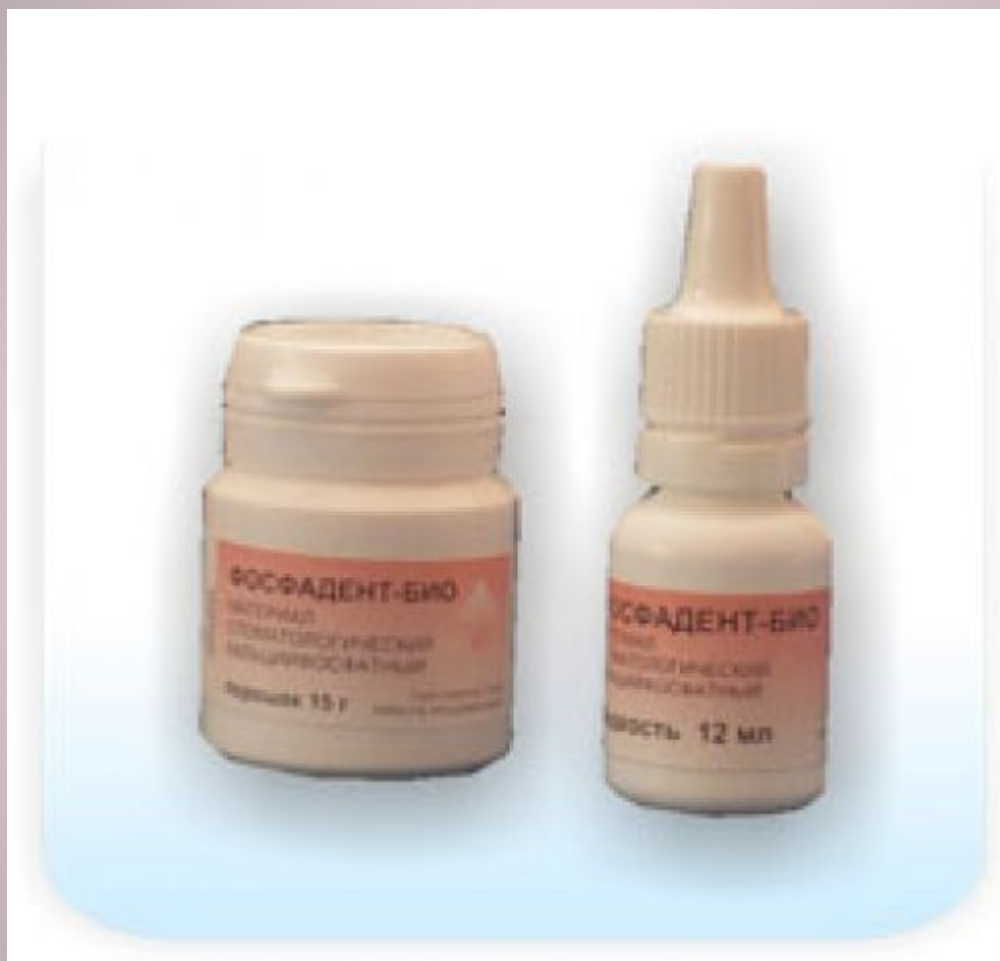
Фосфадент Био - цемент стоматологический