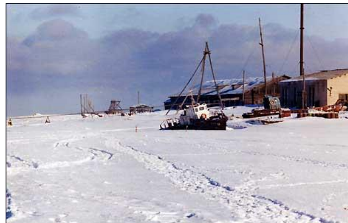
Замерзающее Белое море