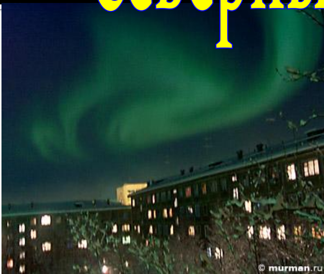
Полярная ночь. Северное сияние