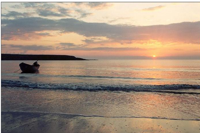
Незамерзающее Баренцево море